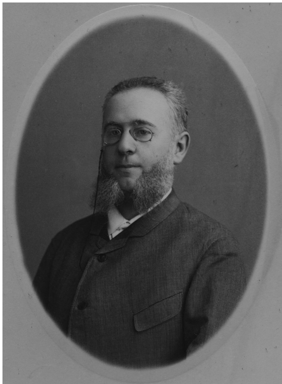
Я. К. Гуревич Фотография. Петербург, конец 1870-х гг.

скобках восстанавливаются недостающие фрагменты слов; слова, прочтение которых вызывает сомнение, отмечены вопросительным знаком в ломаных скобках.