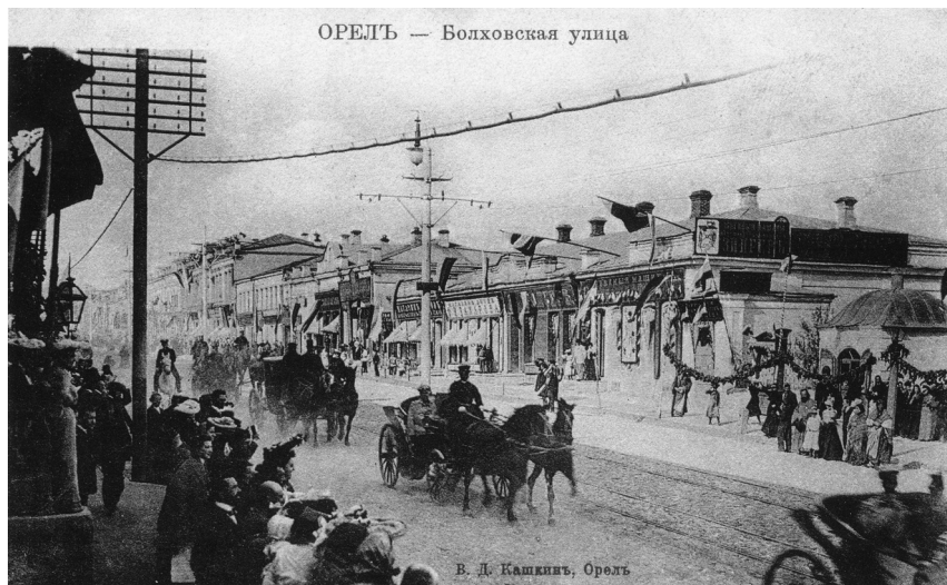
Болховская улица в Орле

рами дамы „высшего общества“, под руку со знакомыми кавалерами. За ними медленными шагами ехала карета или стояла, ожидая, чтобы их доставить домой, в соседний квартал. Так вся жизнь и проходила, связанная узкими рамками „хорошего тона“: порвать ее не могли жители орловского „Сен-Жермена“». 19