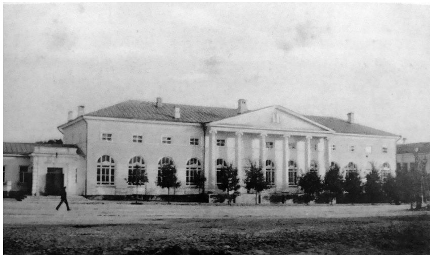
Дворянское собрание в Орле