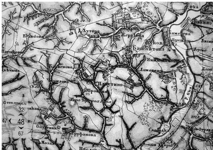
Фрагмент карты Орловской губернии 1863 г., на котором обозначены Цветынь, Клейменово и Башкатова