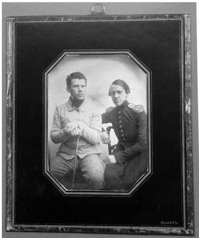
Л. Н. и Н. Н. Толстые. Дагерротип К. П. Мазера. Москва, 1851 г. Государственный музей Л. Н. Толстого (Москва)

в своих мемуарах Е. М. Гаршин: «То смирение перед жизнью, — говорил нам Иван Сергеевич, — которое Лев Толстой развивает теоретически, брат его применил непосредственно к своему существованию. Он жил всегда в самой невозможной квартире, чуть не в лачуге, где-нибудь в отдаленном квартале Москвы, и охотно делился всем с последним бедняком. Это был восхитительный собеседник и рассказчик <...>». 5