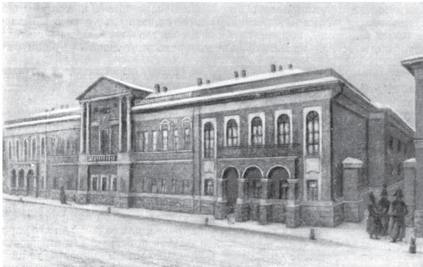
Училище колонновожатых. Москва, Большая Дмитровка. Акварель Б. Земенкова