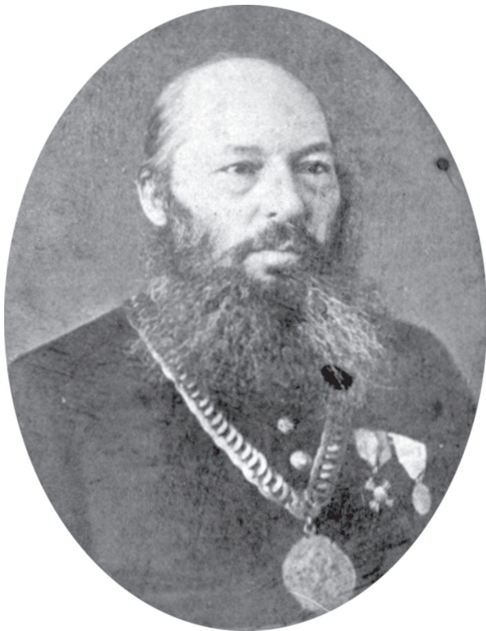
Фет с цепью мирового судьи. Орел, начало 1870-х гг. (?)

Как-то вы доехали, друзья милые. Я все рассчитывал, и, по-моему, засветло миновали тульских разбойников.