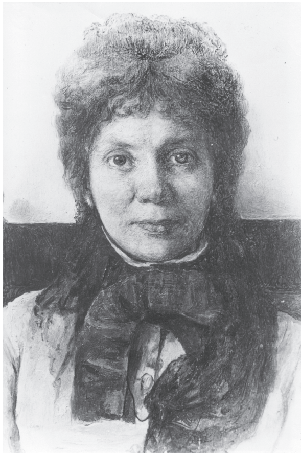
М. П. Фет.

Портрет работы М. П. Боткина (?). Начало 1870-х гг.