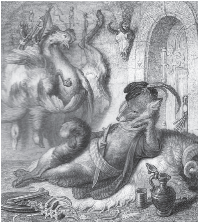
Иллюстрация по рисунку В. Каульбаха к поэме И.-В. Гёте «Рейнеке-лис» (гравюра на меди)

Если не удастся убедить старика оставить Спасское, то ему предстоит много, много еще горя впереди, и, что хуже, это то, что вина его . Нельзя насильно оставаться в чужом имении и управлять им, когда владелец этого не хочет. Я это уже ему говорил.