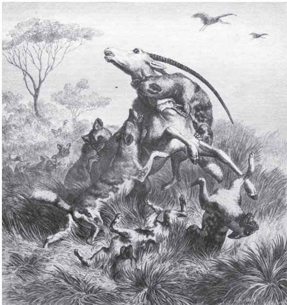
«Охота на антилопу».

Ксилография В. Арланда по рисунку Г. Лейтеманна из журнала «Die Gartenlaube» (1867. № 2)