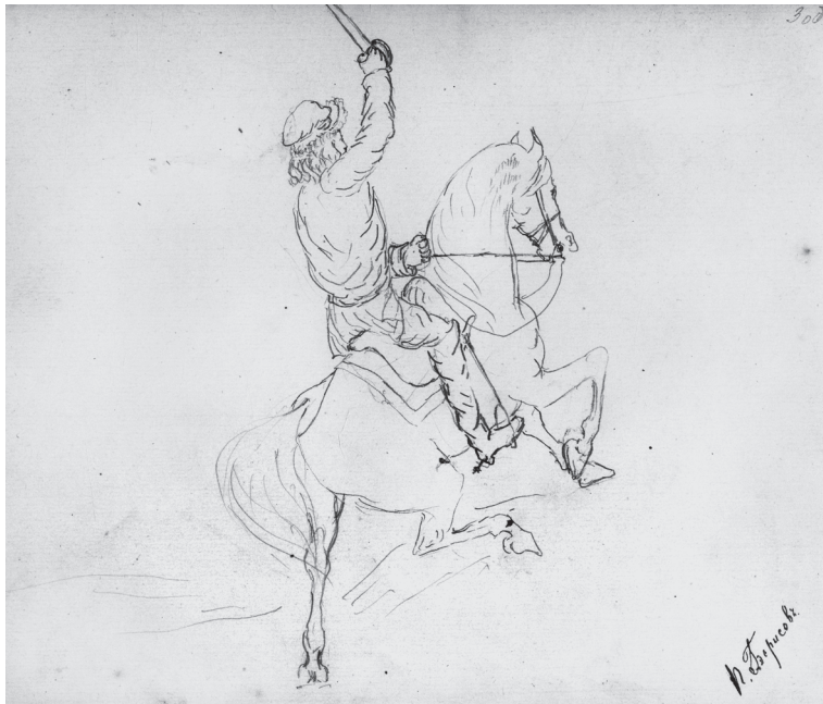
Всадник. Рисунок П. Борисова. 1868 г.