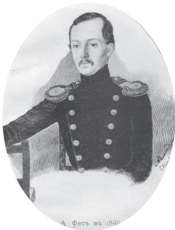
Фет в форме корнета Кирасирского Военного Ордена полка. С акварели А. В. Сливкиной. Александрия, 1846 г.

Очевидно, что в «кирасирской» части мемуаров, как и в главах, повествующих об учебе в пансионе в Верро, больше умолчаний и недосказанностей, чем в «московской» части. Непросто на основании нескольких беглых мемуарных эпизодов представить во всей полноте, насколько психологически тяжелой была жизнь Фета в пансионе Крюммера, где ему пришлось в разных формах испытать то, что он сдержанно назвал «приставанием к слабому» (С. 99), вскользь упомянув в другой части текста и о «пытке», «выстраданной» в Верро (С. 151). О «тайнописи» Фета-мемуариста Б. Я. Бухштаб писал: «В жизни его было много событий, которые он привык скрывать и замазывать, и центральные факты его личной жизни (происхождение, романы, женитьба, отношения с сестрами и братьями и т. п.) описаны какой-то тайнописью, соединенной с явными измышлениями. / Но и те события, в которых скрывать было нечего (как, скажем, поступление в офицеры, отставка, переселение в деревню), описываются лишь