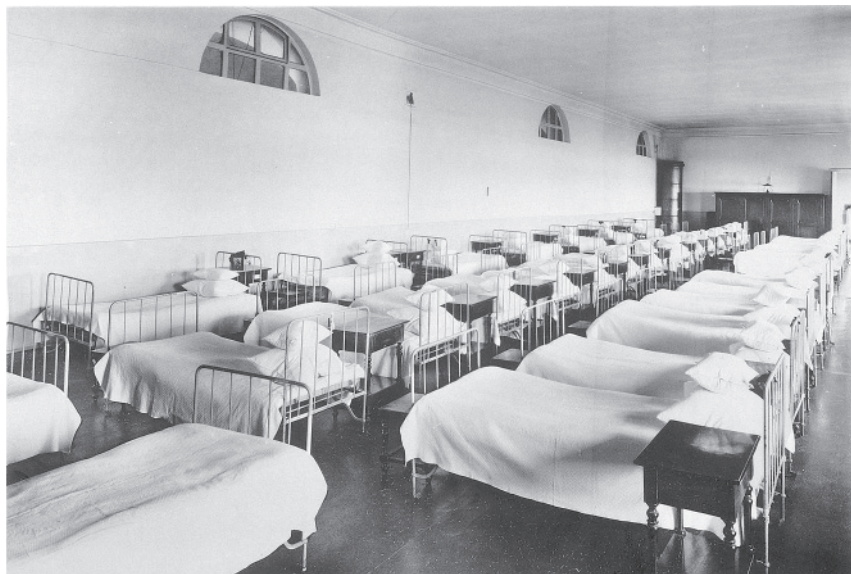
Смольный институт. Дортуар