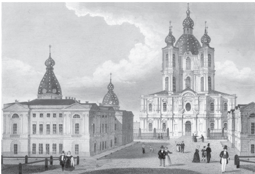
Собор Смольного монастыря. Петербург, около 1840-х гг. Гравюра на стали

называемые своекоштные воспитанницы, за которых платили их родственники. 5