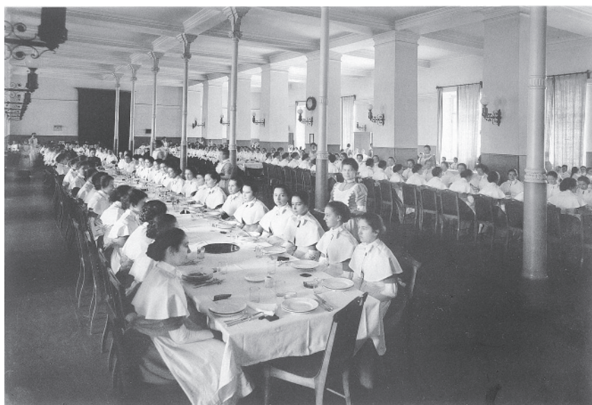
Смольный институт. Столовая. Петербург, 1880-е — начало 1900-х гг.