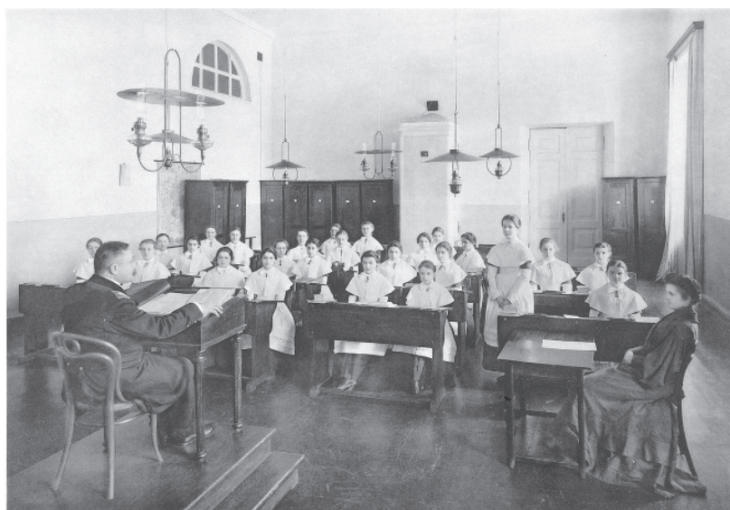
Смольный институт. Урок французского языка в III классе неевского (второго) отделения. Петербург, 1880-е — начало 1900-х гг.