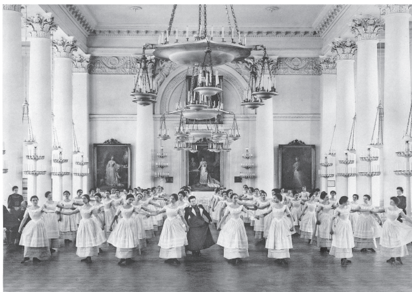
Смольный институт. Урок танцев. Менуэт. Фотографии Товарищества «Р. Голике и А. Вильборг». Петербург, 1880-е — начало 1900-х гг.