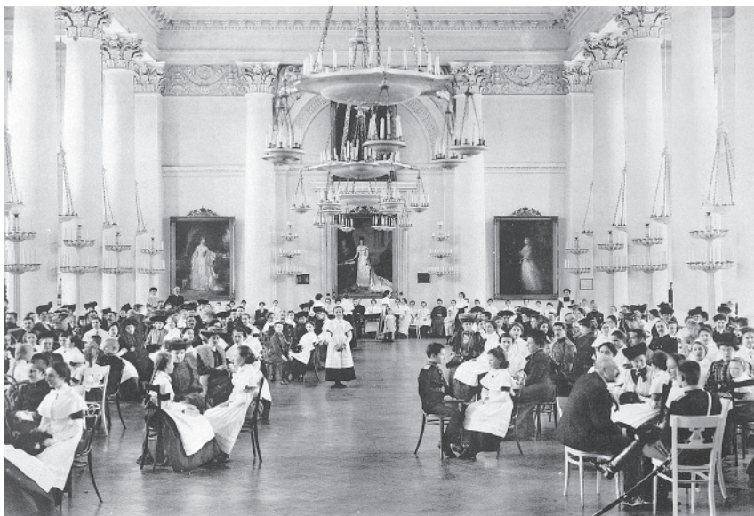
Смольный институт. Прием родителей