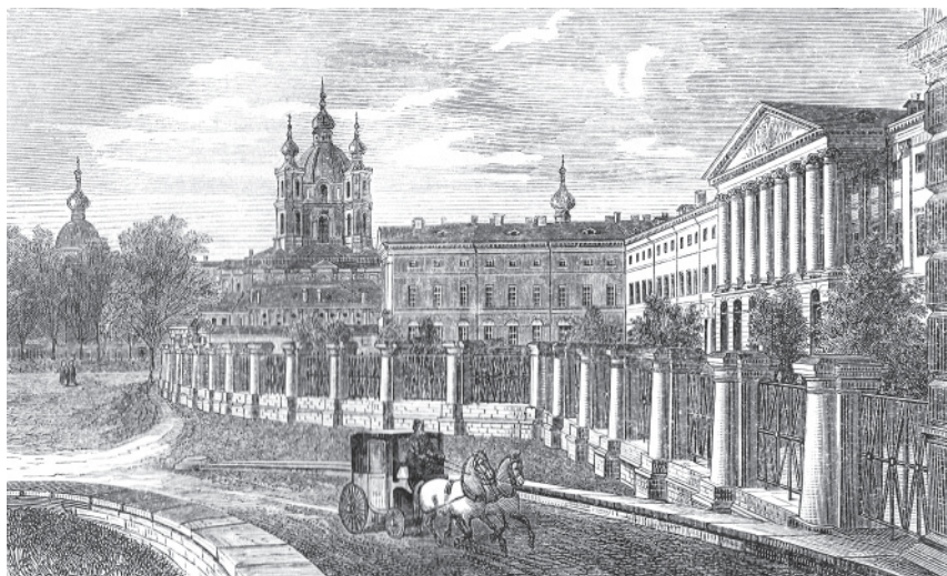
Здание Императорского Воспитательного общества благородных девиц. Гравюра. Около 1864 г.

ства к древнему дворянству уже после того, как в 1830 году без хлопот оформил потомственное дворянство по своему чину ротмистра. 8