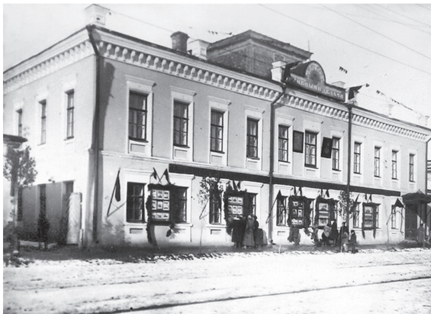
Почтово-телеграфная контора на ул. Садовой в Орле, во дворе которой находилась почтовая гостиница, где останавливался Фет. Фотография начала XX в.

Во второй половине XIX века это был загород. Шоссейная дорога на Москву в этом месте еще не называлась улицей Московской. С вокзала до «города» пассажиров довозили извозчики. Фет приехал «на своих» на нынешнюю улицу Московскую и, разочарованный потерей летнего дня, отбыл, как упоминалось выше, в почтовую гостиницу, оставив веретено на заводе.