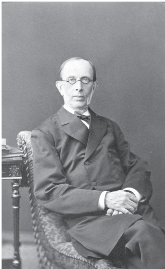
К. П. Победоносцев. 1880-е гг.

тельным началам»; остальная «охранительная» печать, по его мнению, была «мелочью, или дрянью или торговой лавочкой». Победоносцев со страхом предвидел, что после смерти Каткова «решительно некем будет заменить его». 3 Охранительная позиция влиятельного редакто-