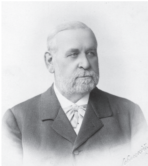
Е. М. Феоктистов. 1880-е гг.

высших правительственных кругов или «голодные» воинствующие прогрессисты; авторитету Каткова и его изданиям отводилась сдерживающая, спасительная роль.