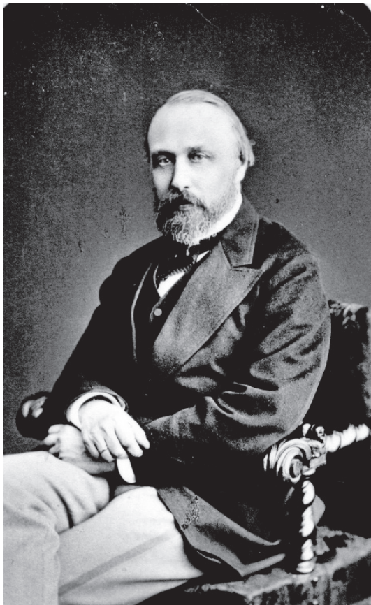
М. Н. Катков.

ра находила свое упорное и настойчивое выражение в передовицах «Московских ведомостей», а также в статьях политического отдела «Русского вестника» и снискала ему специфическое положение «министра без портфеля». 4 Выступления Каткова 1870—1880-х годов, по наблюдению исследователя, были посвящены критике «земской и судебной реформ», «национального сепаратизма, особенно польского», который трактовался им в этот период «как широкий „заговор против