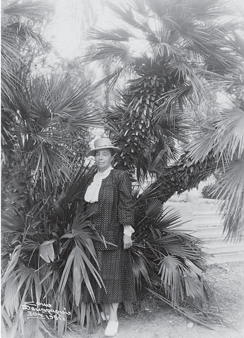
Рис. 5. Сочи. 1951 г.