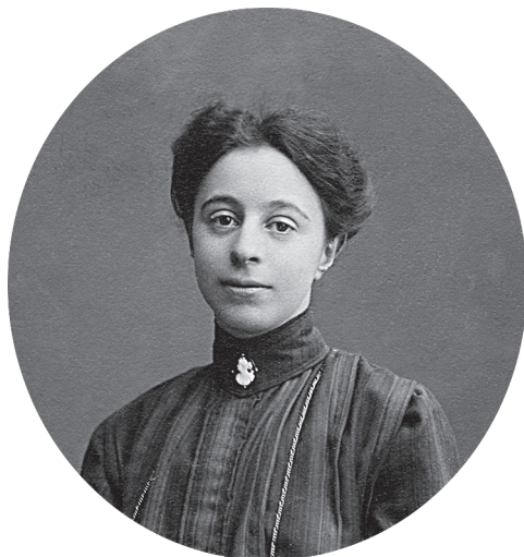
Рис. 2. Из выпускного альбома Женского педагогического института. 1909 г.

города Верного (Алма-Аты). Отказаться Надежда не могла, так как семья нуждалась в ее зарботке.