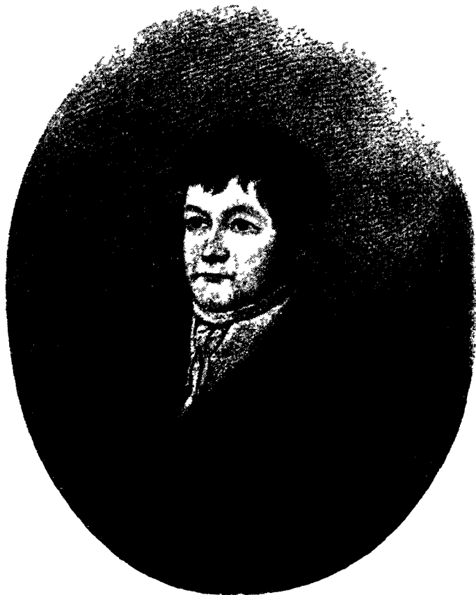
Дымная Печурка или Две огромные руки — А. Ф. Воейков.

Или гармония пуза Эоловой Арфы тебя изумила? Тише ль бурчало оно в часы пресыщенья, когда им Водка, селедка, конфекты, 1 котлеты, клюква и брюква Быстро, как вечностью годы и жизнь, поглощались? Знай же, что ныне пузо бурчит и хлебещет не даром!