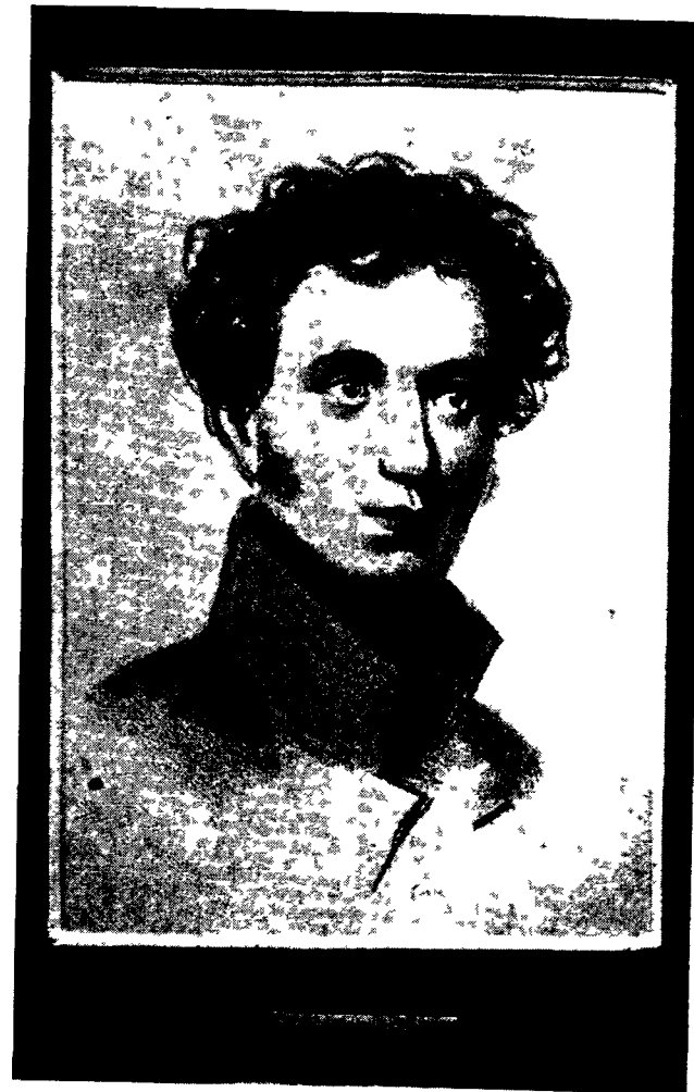
Сверчок — А. С. Пушкин.