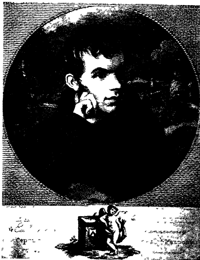
Светлана — В. А. Жуковский.

Вступая в сие святилище, ты на каждом шагу видишь цель и бытописания нашего Общества: ты переносишься в трудные времена, предшествовавшие обновлению благословенного Арзамаса, когда мы скитались в стране чуждой и дикой, между гиенами и онаграми, между халдеями Беседы и Академии. На каждом шагу видишь следы претерпенных нами