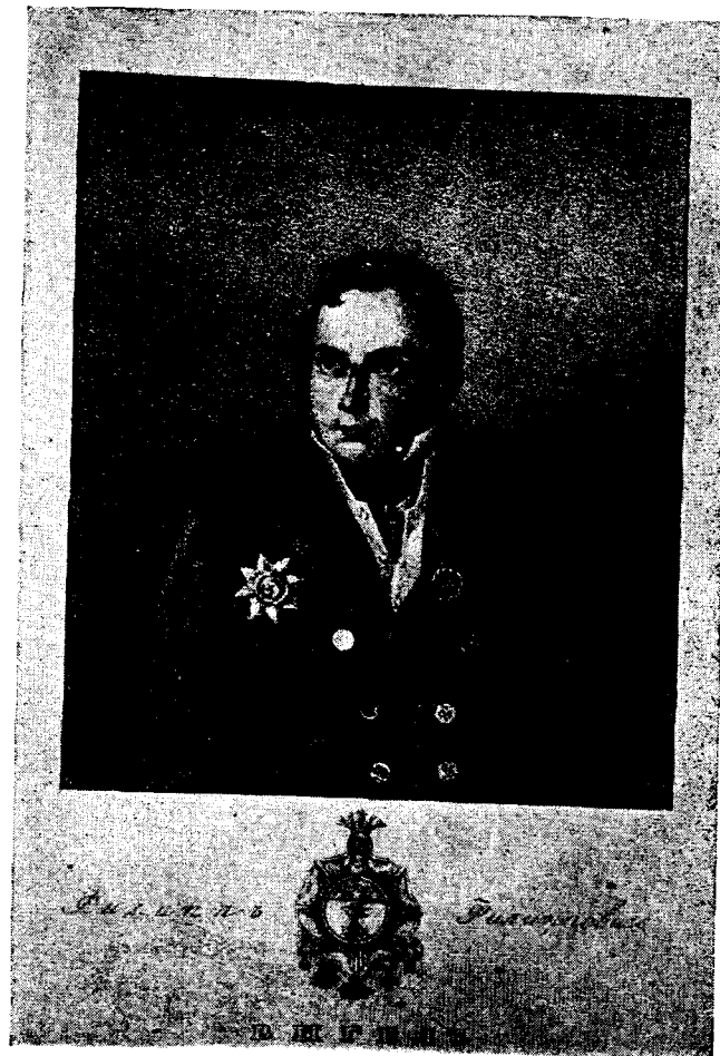
Ивиков Журавль — Ф. Ф. Вигель.