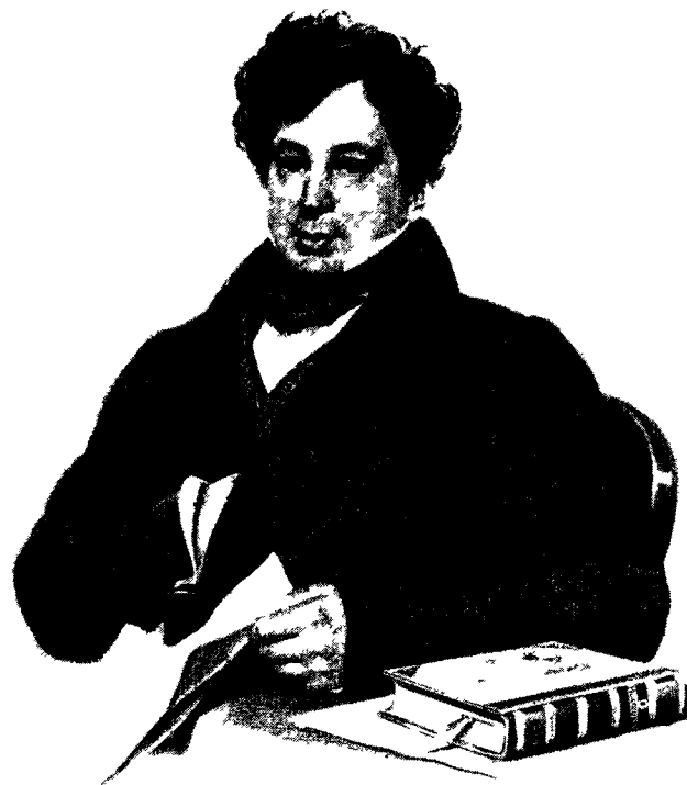
Эолова Арфа — А. И. Тургенев

Дашков возвращается в Петербург и на заседании Арзамаса рассказывает о своем фантастическом посещении «досуемого беса Хлыстова» (должно подразумевать Н. И. Гнедича, бывшего в хороших отношениях с Д. И. Хвостовым и не пользовавшегося любовью в Арзамасе). Дашков перечисляет «сокровища» Беседы, некогда принадлежавшие беседчикам, показанные ему колдуном-досужим бесом в его жилище, включительно