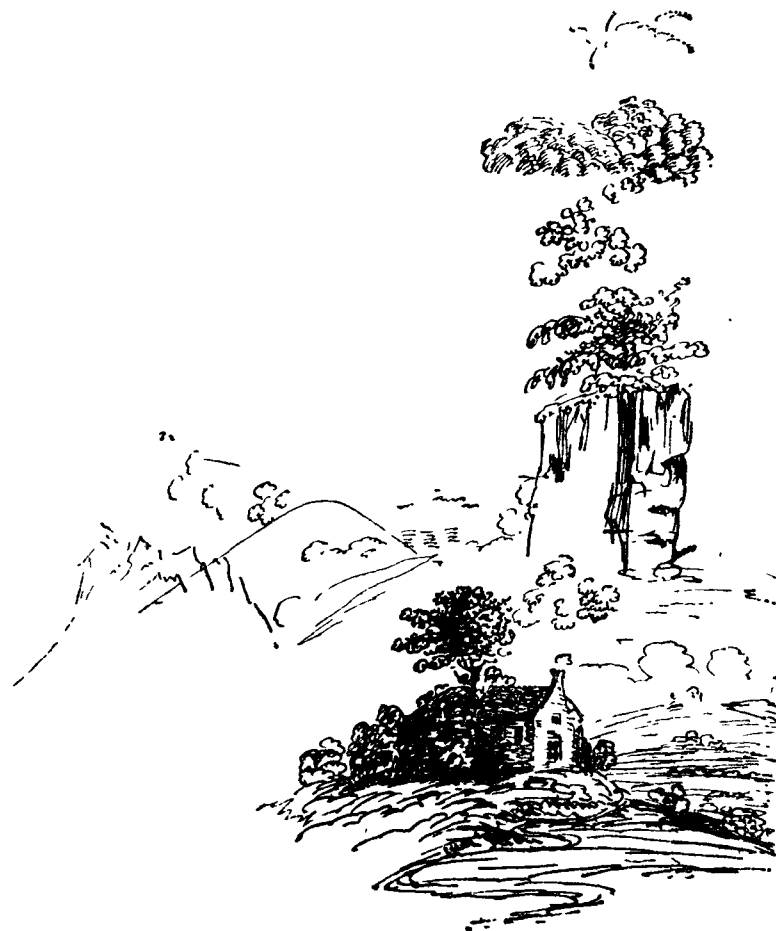
Рисунок, сделанный В. А. Жуковским.

Секретарь Общества Светлана сообщил мне предложение члена Чу!! вместе с формулою тоожественного обещания.