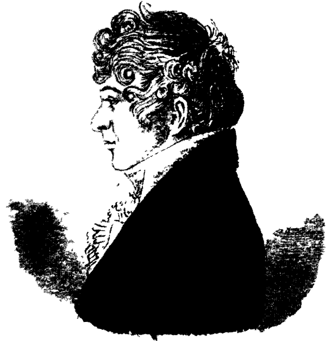
Ахилл — К. Н. Батюшков.

Нам остается сочетать в журнале примеры двух наших журналистов и разделить издание на три разряда: Нравы, Словесности и Политика. В первом объявить войну неприимимую предрассудкам, порокам и нелепостям, картину нашего общества. Нападать на это есть уже действительная дань, приносимая добру. Во втором вести ту же войну с теми же врагами, стреляющими в нас, в здравый рассудок и вкус из окон Беседы и Академии: но вместе с тем 2 отучая публику