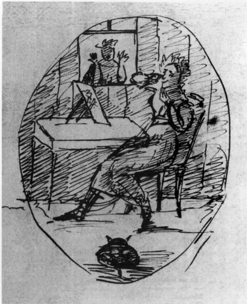
«Мавруша бреется» (ПД 915. Л. 9об.).