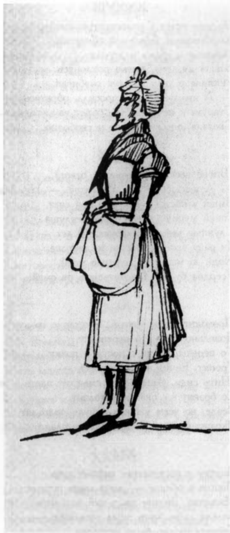
«Мавруша» (ПД 915. Л. 7об.).