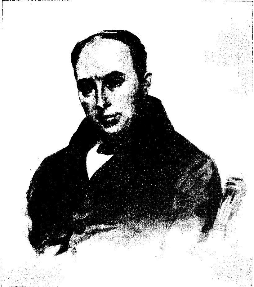
В. А. ЖУКОВСКИЙ. Акварель П. Соколова. Государственный Литературный музей