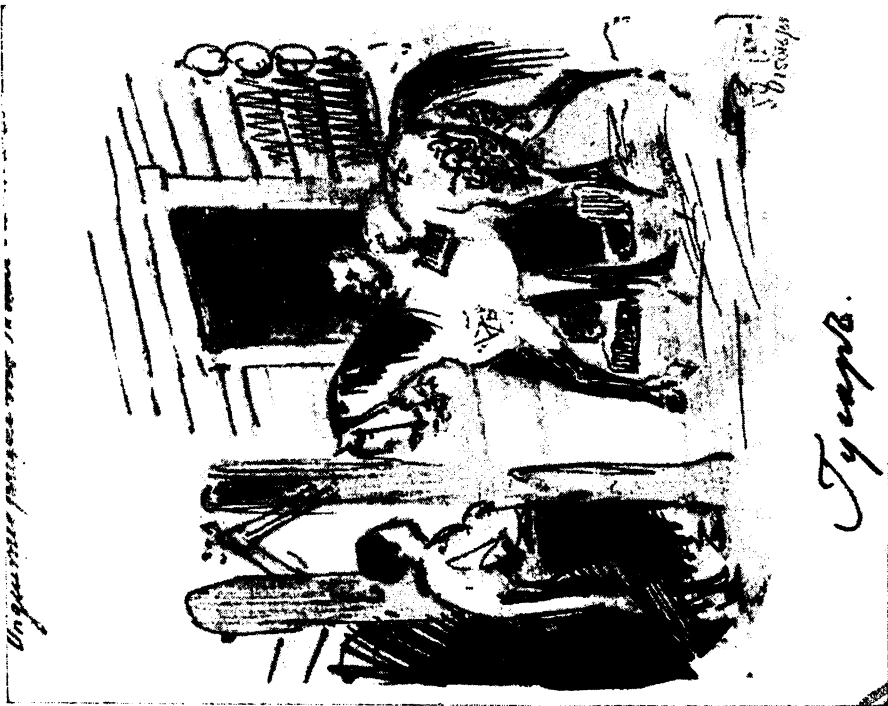
РИСУНОК Г. Г. ГАГАРИНА К «ГУСАРУ». Начало 1890-х гг. Государственный Русский музей