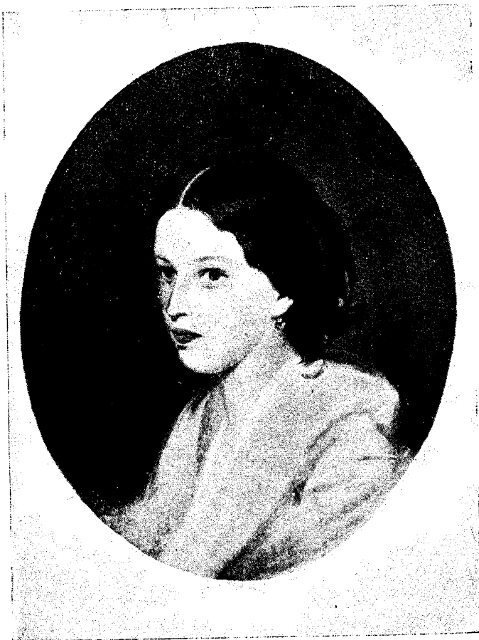
Н. А. ПУШКИНА, МЛАДШАЯ ДОЧЬ ПОЭТА. Портрет маслом Макарова, 1850-ые гг. Государственный Литературный музей