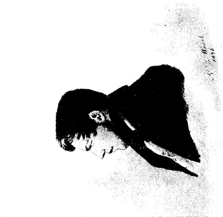
П. В. НАШОКИН. Акварель Н. Вакселя, 1886 г. Государственный Литературный музей