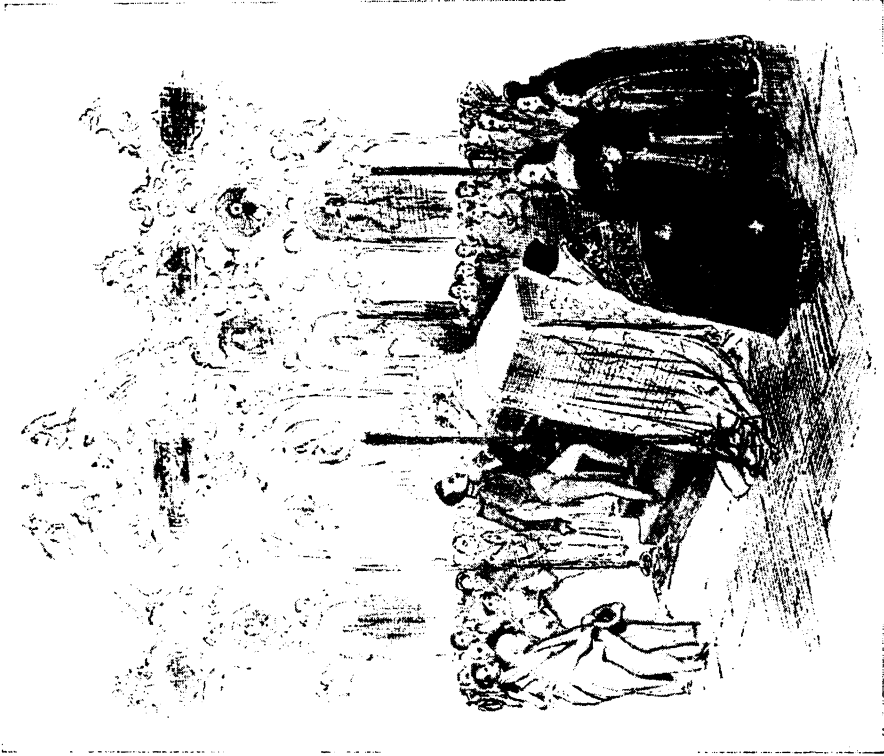
РИСУНОК Г. Г. ГАГАРИНА К «ЛИКОВОЙ ДАМЕ», 1886 г. Институт Литературы АН СССР