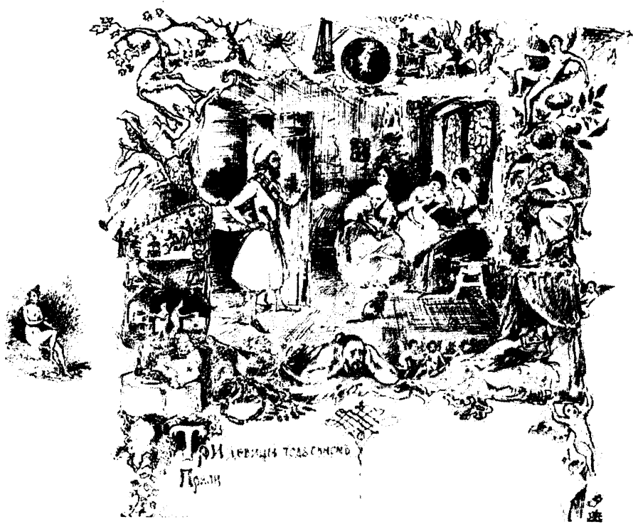
РИСУНОК Г. Г. ГАГАРИНА К «СКАЗКЕ О ЦАРЕ САЛТАНЕ», 1836 г. Институт Литературы АН СССР