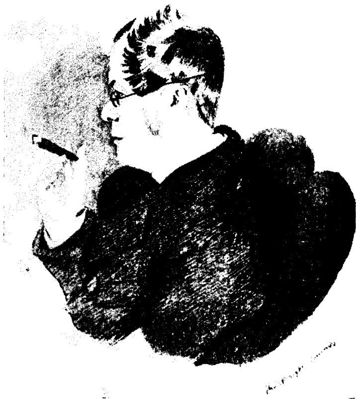
П. А. РЯЗЕМСКИЙ. Акварель Т. Райта, 1844 г. Государственный Литературный музей