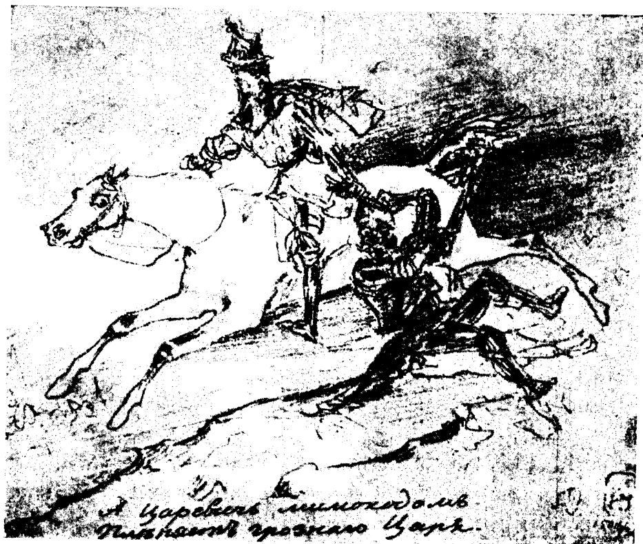
РИСУНОК Г. Г. ГАГАРИНА К «РУСЛАНУ И ЛЮДМИЛЕ», 1838 г. Государственный Русский музей