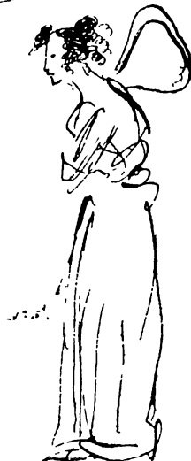
Автограф Пушкина (из Берлинской Публичной библиотеки).