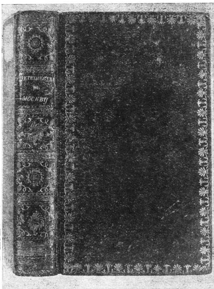
Внешний вид книги «Путешествие из Петербурга в Москву», в которой сохранились редакционные заметки А. Н. Радицева.