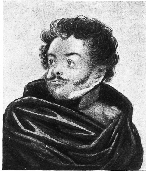
Денисъ Васильевичъ ДАВЫДОВЪ.