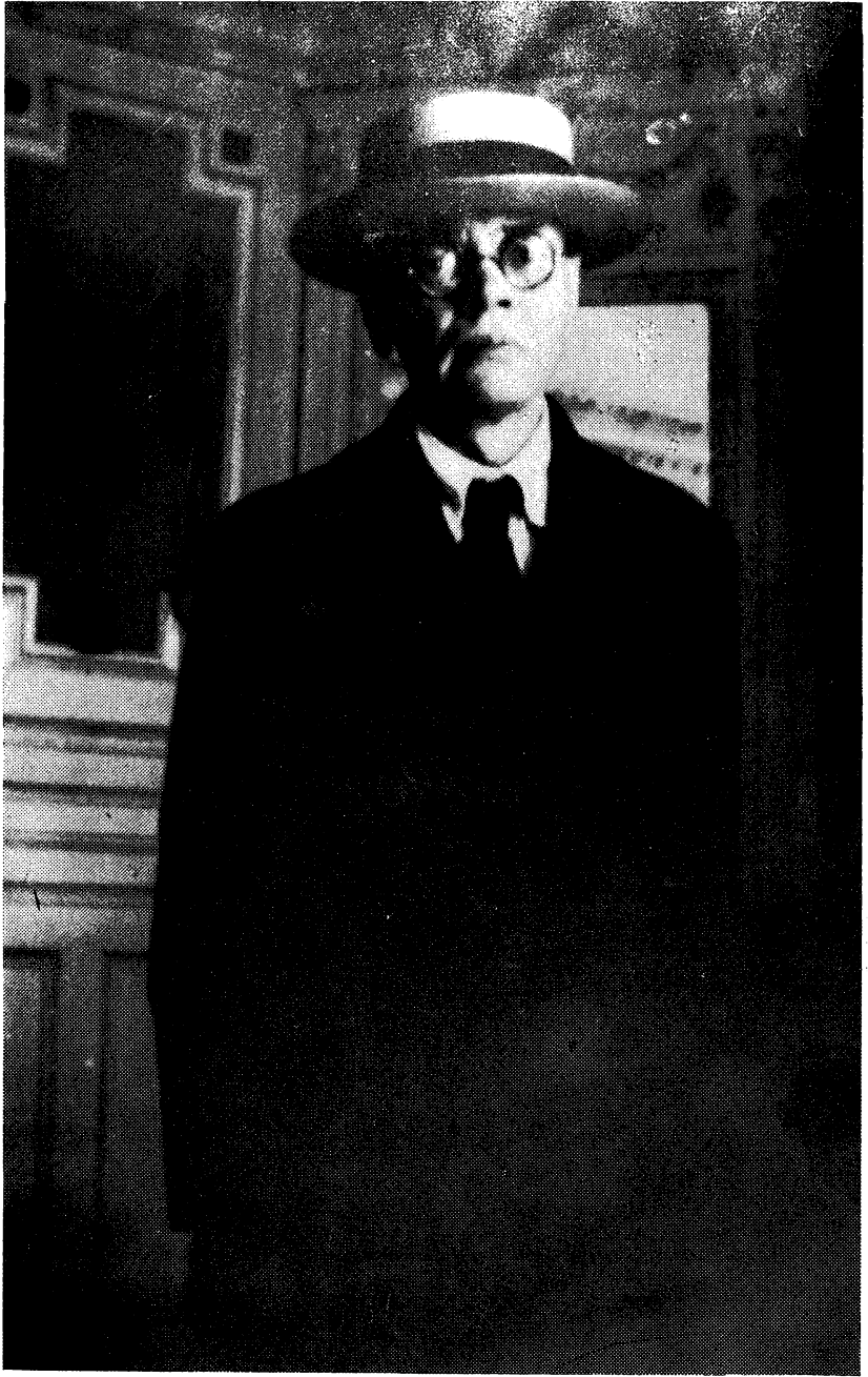
А. М. Ремизов. Фото. 1930-е годы. (Р. О. Пушкинского Дома)