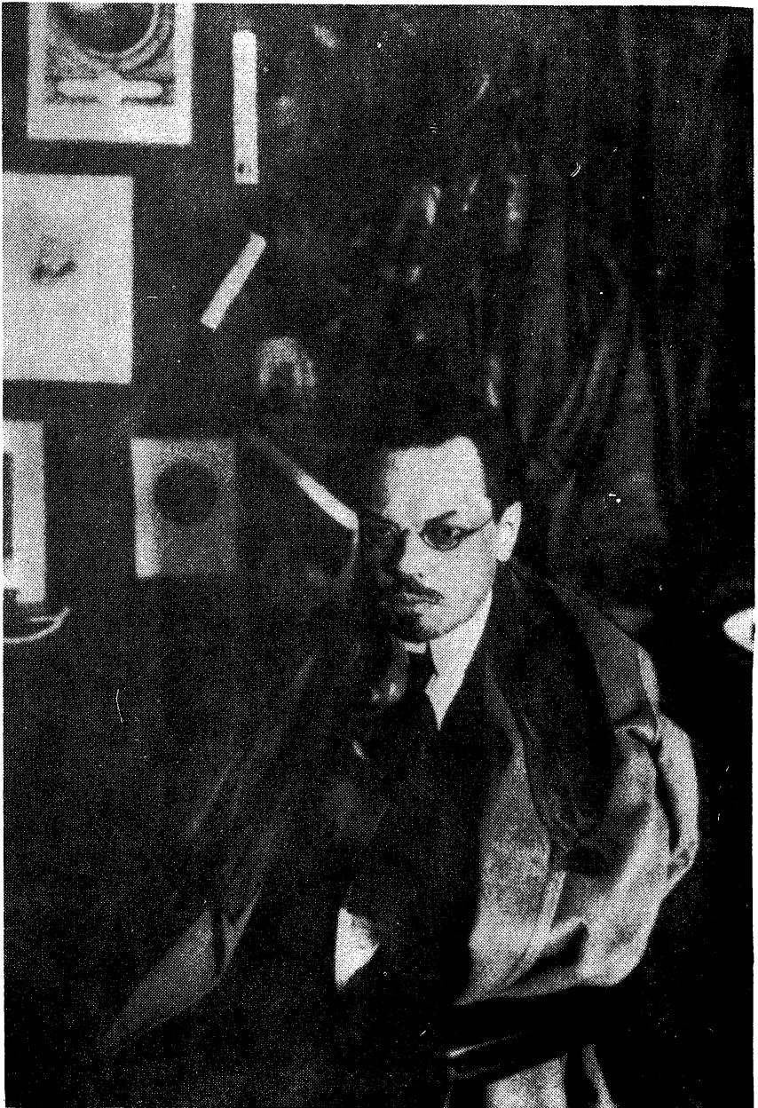
А. М. Ремизов. Фото. 1910-е годы.