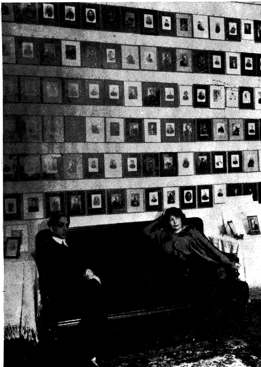
М. А. Кузмин и Е. А. Нагородская. Фото. 1910-е годы. (Р. О. Пушкинского Дома)