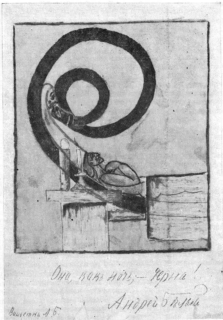
Андрей Белый. «Танка». Рукописная книжка (последний лист). 1920 г.

кармливать автора, и многие занялись этим делом серьезно. Книжек выпускали мало, но продавали их очень дорого, в расчете на