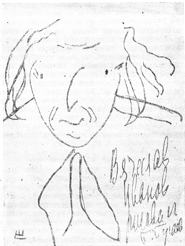
Вячеслав Иванов. Шарж Андрея Белого. 1922 г.

из своих последних изданий. Трудно установить, какую именно книгу Новиков-Прибой подарил Белому: в 1926—1927 гг. в Харькове было выпущено его собрание сочинений в 5 томах; кроме того, в 1927 г. было начато печатанием (вышли тома 2—5) пятитомное собрание сочинений писателя в издательстве «Земля и