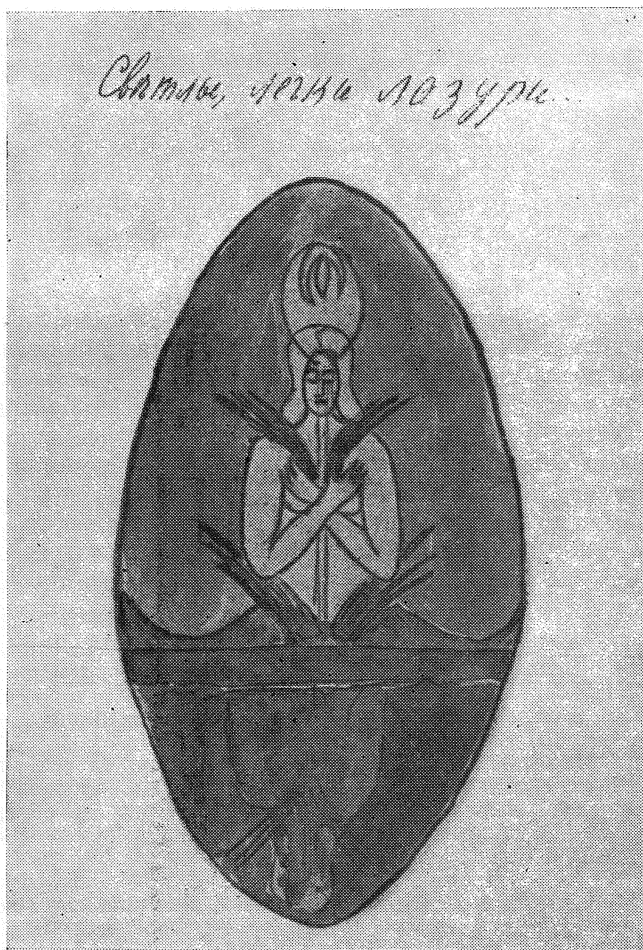
Андрей Белый. «Танка». Рукописная книжка (лист рукописи). 1920 г.

московской Книжной лавке писателей М. А. Осоргниным, который вспоминал об этом начинании: «В тяжкие 1919—1921 годы московской разрухи и голодания печатание книг было для писате-