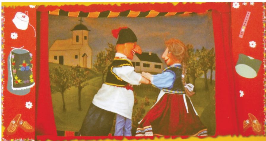
20. Сценка из современного спектакля «Куку Тодор» (реж. А. Вученович)