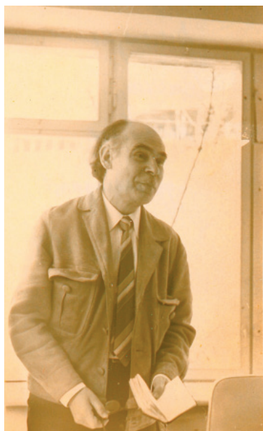
На Всесоюзном семинаре молодых фольклористов. Апрель 1974 г.