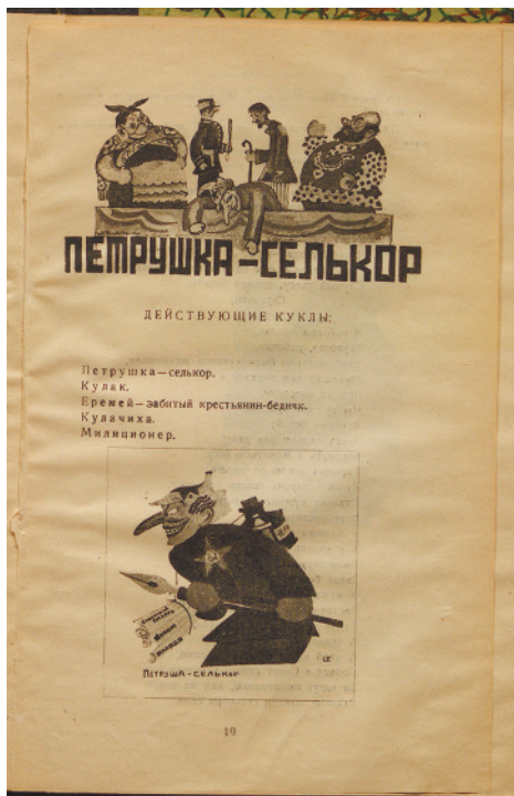
10. Петрушка-селькор. Иллюстрация к одноименной пьесе Ф. Биллера