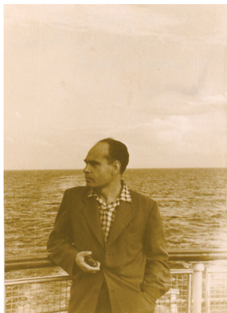
На Онежском озере. Август 1960 г.