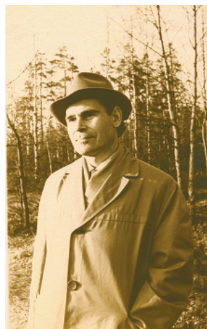
1964 г. В Сосновке