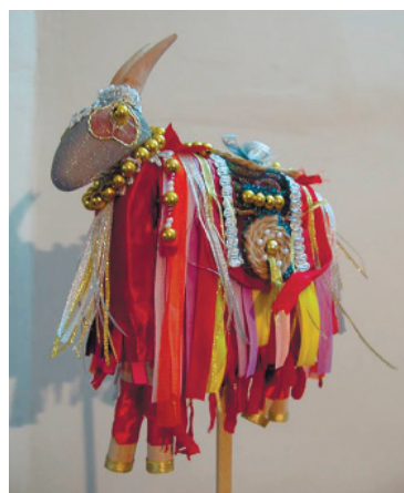
16. Теке у азербайджанцев Ирана