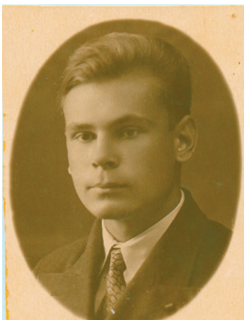
Июль 1936 г.