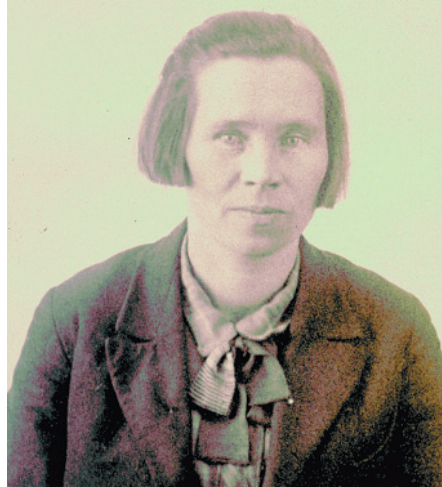
1. П. Г. Ширяева. Ленинград, 1930-е гг. Негатив на стеклянном носителе. МАЭ И 1370-123