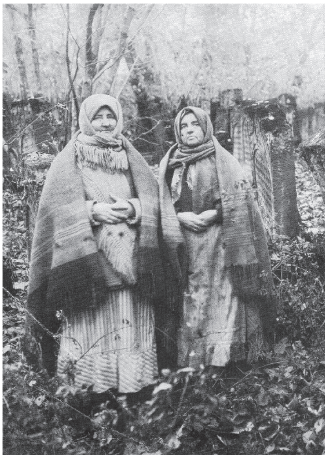
23. Плакальщицы. Г. Острог (Волынское воеводство). 1913 г.