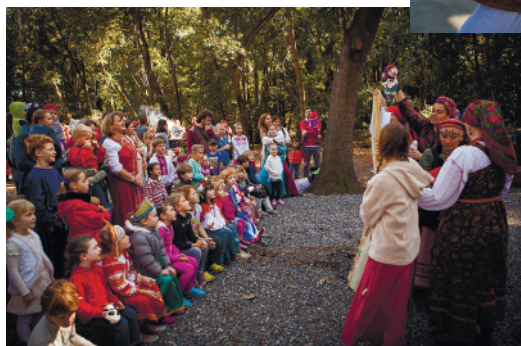
12. Дети — зрители кукольного представления «Кедров»