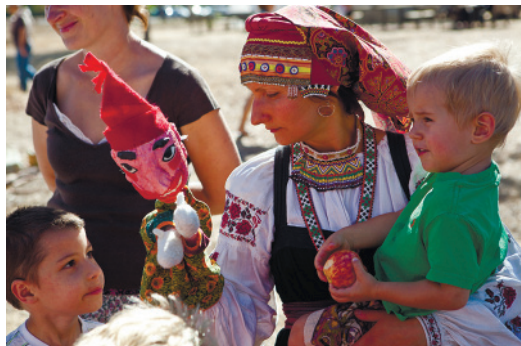
11. Эпизоды выступлений творческой группы «Русский Дом Кедр» (Калифорния, США)