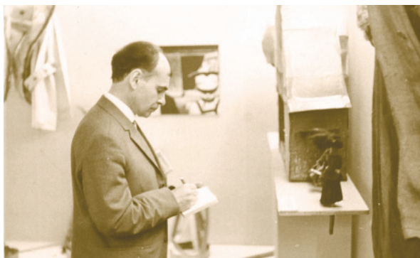
В этнографическом музее. Г. Вроцлав (Чехословакия). Май 1966 г.