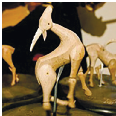
13. Фигурка танцующего козлика