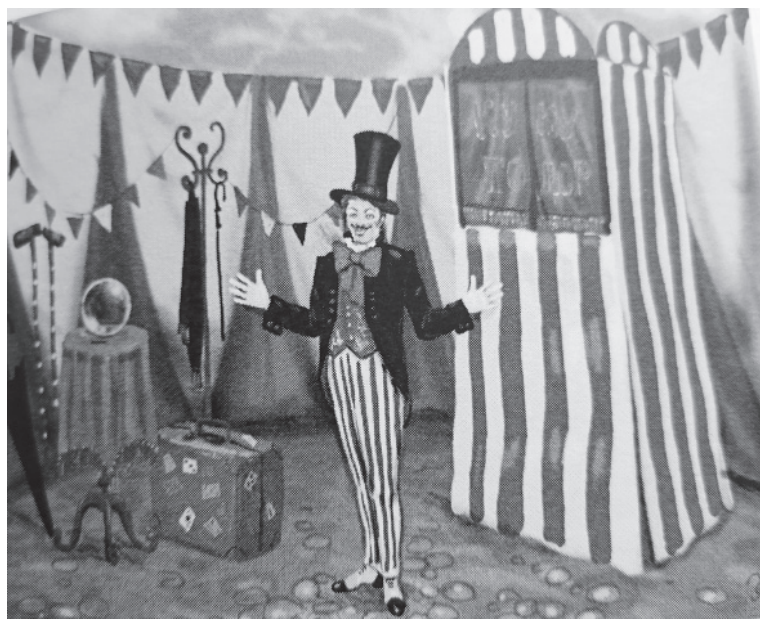
19. Илия Божич в своем шатре. Реконструкция Елены Угловской (2014)