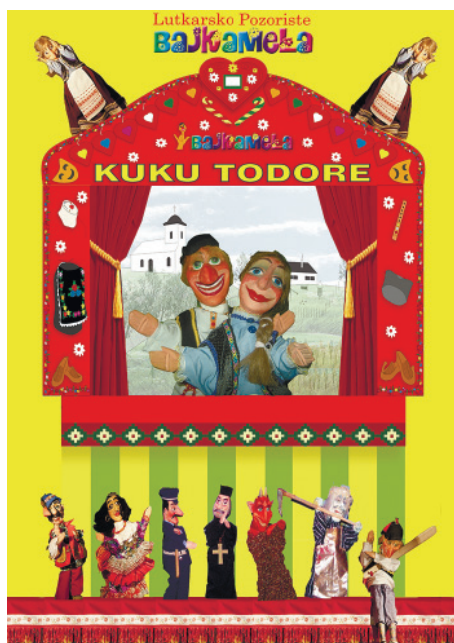
22. Современная постановка «Куку Тодора» (фото на обложке книги А. Вученович «Путь к моему Тодору». СПб., 2015)