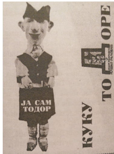
18. Программка к спектаклю «Куку Тодор» Марии Кулунджич