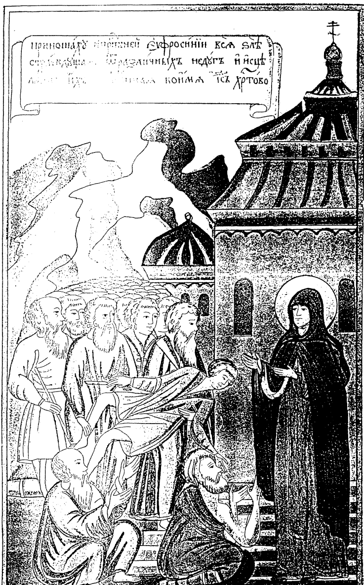
Рис. 6. Миниатюра из Жития Евфросинии Суздальской. XVIII в., в издании 1889 г.