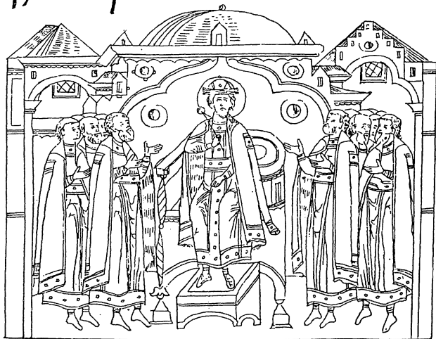
Рис. 4. Миниюра из Жития митрополита Алексея. XVI в., в издании 1878 г.

КІНМЪ ОБРАЗМЪ ОБОМЪ ГАПНА БГЪ ТАКОВОЕ СОКРОКНИЦЕ АРХНЕ РЕА СПВЕГО ЦБЛЕКНЫМЪ МШЦИ . ОНИХЪ ЖЕ СЦЕ БЫСТЬ НАЧАЛО . ОЛВПО БЛАГОЧЕСТНІ ПАГОИХЪ ОЛО КИ ПАГО САМОДЕРЖЪЦА РЪССІІА ЗЕ МАМЪ ВЕЛІКА КНЪА ДКАСІІА ПАСИ ЁКНЧА , ВНЪКА ДОСПОХВАЛЬНАГО ПОКЪДОНОСЦА ЦЕЛІКАГО КНЪА ДМІТРІА ПОАНОВЧА .