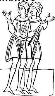
Рис. 2. Миниатюра из Сказания о Борисе и Глебе. XIV в., в издании 1860 г.