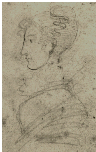
Рисунок на форзаце книги «Clarisse Harlove» из библиотеки Тригорского (ПД 797)

Относительно того, кто изображен на рисунке, было высказано два разных предположения: Б. Л. Модзалевский считал, что Пушкин нарисовал одну из обитательниц Тригорского; 5 по мнению М. Д. Беляева, на форзаце книги изображена сестра поэта Ольга. 6