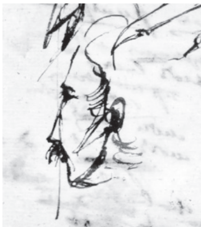
Изображение И. П. Липранди в рукописи стихотворения «Завидую тебе, питомец моря смелый...» (ПД 834, л. 12)