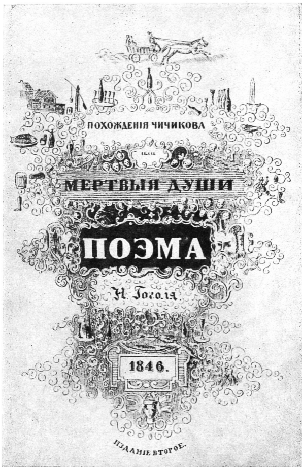
Обложка второго издания «Мертвых душ» (по рисунку Н. В. Гоголя).