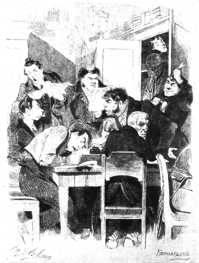
Чиновники в канцелярии присутствия. Рисунок А. А. Агина, гравюра Е. Е. Бернардовского.