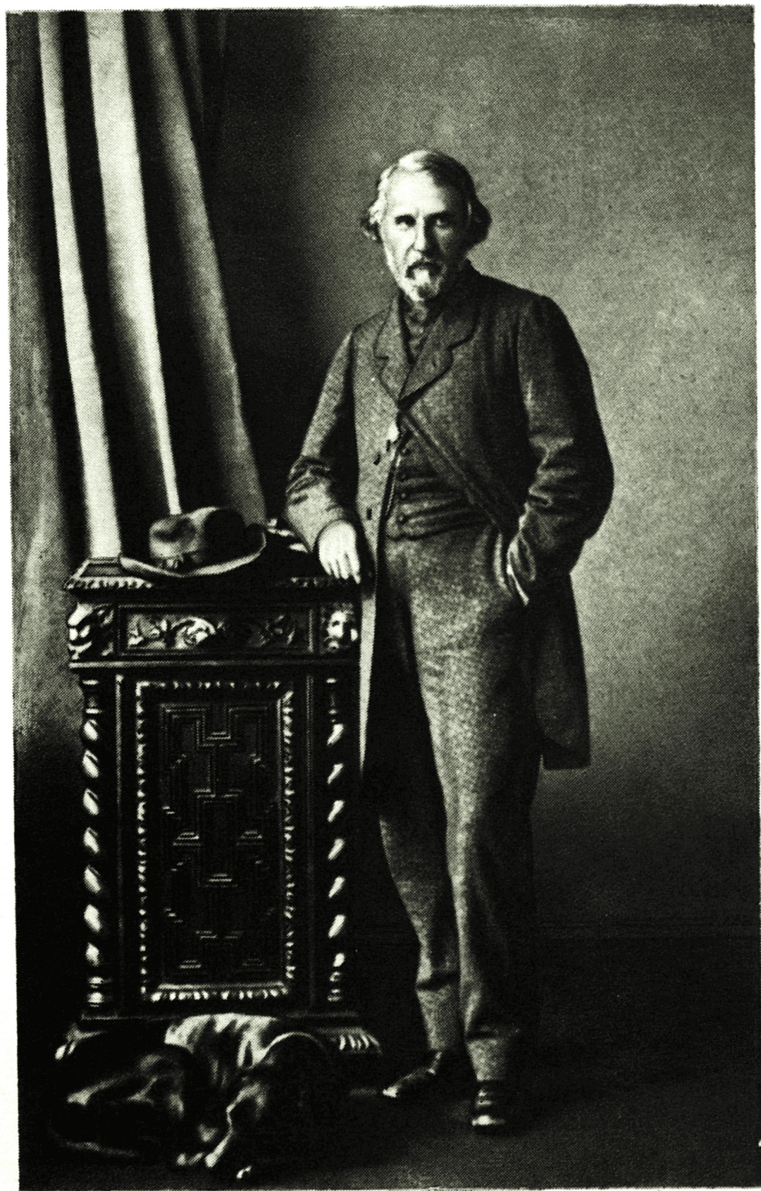
И. С. ТУРГЕНЕВ