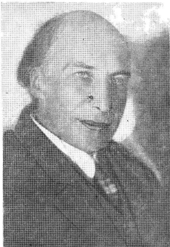
Андрей Белый. Фотография.

1 Белый и К. Н. Бугаева выехали из Коктебеля в Москву 29 июля (Андрей Белый. Передвижения. «Хронологическая канва с 1921 по 1933 г.» — ГБЛ, ф. 25). К. Н. Бугаева писала Томашевским с дороги (31 июля 1933 г., «Курск—Орел. 8 вечера»): «До сих пор все идет хорошо. Б. Н. совершенно изменился. И выражение лица, и движения, и походка — все опять его. Точно в Коктебеле он скинул с себя свою болезнь. Едем мы спокойно. Ночь прошла тихо, без всяких болей. И затылок, и спина, и виски — все успокоилось. С какой благодарностью вспоминаем мы Вас обоих — вплоть до „нафталина“». Письмо было закончено и отправлено в Москве: «Мы уже дома. Встретили с автомобилем. Сейчас Б. Н. устал и прилег. Голова опять побаливает. Но это, вероятно, впечатление встречи и возвращения домой». Ср. письмо К. Н. Бугаевой к М. С. Волошиной от 31 июля 1933 г.: «Подъезжаем к Харькову. Б. Н. спал спокойно. С утра ни головных болей, ни болей в спине не было. И лицо стало живое. Исчезло это ужасное выражение, которое меня так пугало» (Архив М. С. Волошиной).