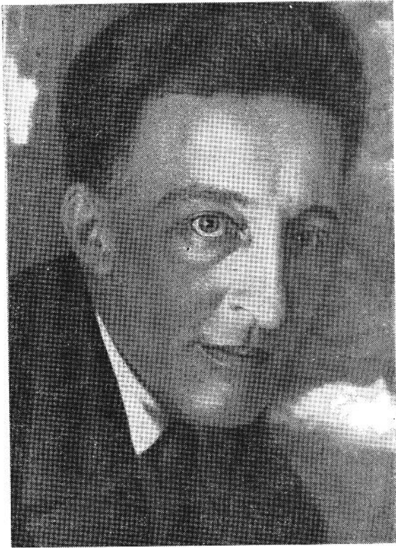
А. Блок. Фотография. 1921 г.