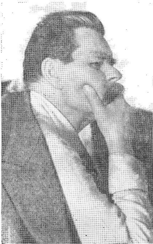
М. Горький. Фотография. 1935.

об участии писателя в деятельности Пушкинского Дома. Во-первых, Горький жертвовал в Пушкинский Дом историко-литературные и художественные ценности, лично ему принадлежавшие; во-вторых, оказывал содействие в приобретении рукописей и изобразительных материалов для рукописного отдела и музея; в-третьих, на протяжении долгого времени (в 20-е гг.) посылал в библиотеку Пушкинского Дома книги, в основном с публикацией своих произведений и произведений других русских писателей; в-четвертых, передавал Пушкинскому Дому свой архив и намеревался сосредоточить здесь все свое рукописное наследие; наконец, в 1935—1936 гг. он был директором Института. Названные пять направлений в деятельности Горького, связанной с Пушкинским Домом, и будут рассмотрены в дальнейшем изложении.