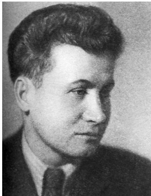
В. Н. Ажаев

Роман «Далеко от Москвы» (1948) был написан А. на Дальнем Востоке (до опубликования роман несколько лет пролежал в «сыром виде» в ж. «Дальний Восток»). В центре произведения — огромная стройка, завершение которой в срок (а дело происходит в годы войны) имеет первостепенное, даже жизненное значение для всех вовлеченных в эту работу людей. А. создал в романе немало выразительных характеров: Алексея Ковшова, Беридзе, Залкинда. Писатель как бы продолжил традицию советского производственного романа 1930-х — «Время, вперед!» В. Катаева, «Энергия» Ф. Гладкова и др. Та же поэзия темпа, скорости выполнения и опережения плана, что дополнительно было оправдано и подстегнуто атмосферой войны. Читатель тех лет, горячо восприняв-