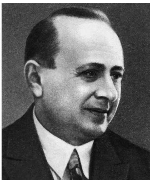
В. Н. Билль-Белоцерковский

Весть о Февральской революции 1917 в России побудила Б.-Б. вернуться на родину и без колебаний стать на сторону большеви-