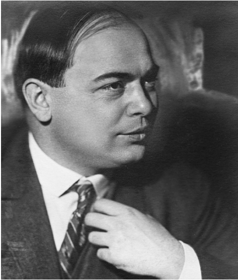
С. Ф. Буданцев

БУДАНЦЕВ Сергей Федорович [28.11 (8.12).1896, имение Глебково Зарайского у. Рязанской губ.— 6.2.1940, близ Магадана] — прозаик, поэт, драматург, лит. критик, публицист.