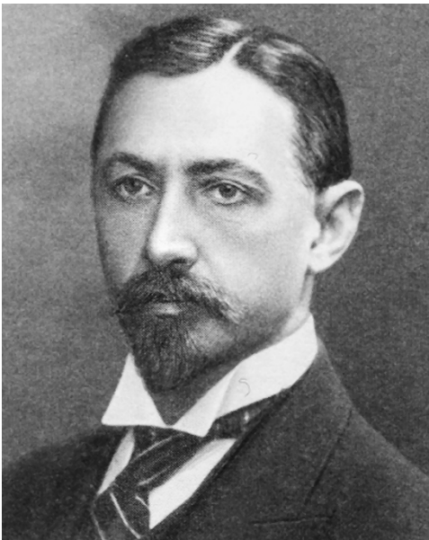
И. А. Бунин