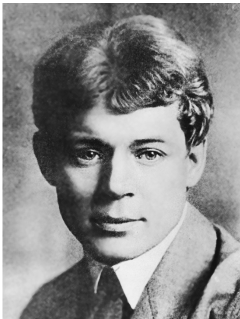
С. А. Есенин

Первые поэтические опыты пробуждаются рано и прежде всего под влиянием народной и религиозно-духовной поэзии: «Стихи начал слагать рано. Толчки давала бабка. Она рассказывала сказки. Некоторые сказки с плохими концами мне не нравились, и я их переделывал на свой лад» («Автобиография»); «Влияние на мое творчество в самом начале имели деревенские частушки» (Там же). Некоторое время в юности он сочинял,