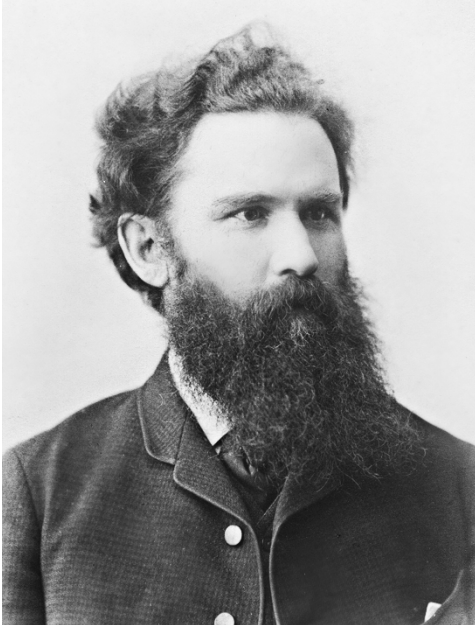
В. Г. Короленко

настоящую родину, «...и то была уже не Польша, не Украина, не Волынь, не Велико-россия, а великая область русской мысли и русской литературы» (Там же).