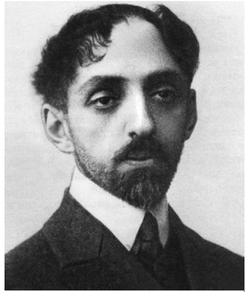
М. А. Кузмин

Из старинного дворянского рода, одним из предков по материнской линии был приехавший при Екатерине II в Россию французский актер Жан Офрен, знавший Вольтера и игравший в его пьесах. В 1874 семья переезжает в Саратов, затем в 1884 в Петербург. К. учится в 8-й гимназии вместе с Г. В. Чичериным (будущим гос. деятелем СССР), который на долгие годы становится его близким другом и confidantом. В 1891 поступает в Петербургскую консерваторию (учится у Н. А. Римского-Корсакова и А. К. Лядова); не окончив ее, уходит, продолжая обучение