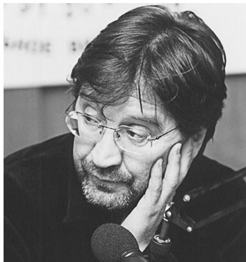
Ю. Ю. Шевчук

В студенческие годы начал сочинять песни, исполняя их под гитару; в 1980 стал одним из организаторов группы «ДДТ». В 1982 — лауреат конкурса «Золотой граммофон», учрежденного «Комсомольской