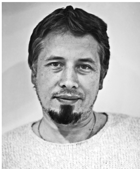
В. Г. Сорокин

СОРОКИН Владимир Георгиевич [7.8.1955, пос. Быково Московской обл.] — прозаик, драматург, киносценарист.