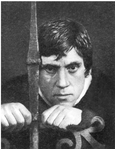
В. С. Высоцкий

Родился в семье служащих. Отец, уроженец Киева, окончил Военную академию связи, участник Великой Отечественной войны. Мать — переводчик. Первые годы жизни В. прошли в Москве; в начале Великой Отечественной войны В. с матерью эвакуируется на Урал, в г. Бузулук Оренбургской обл. Спустя 2 года они возвращаются в Москву. С 1947 по 1949 В. живет в г. Эберсвальде, в Германии, где служит его отец. В эти годы воспитанием В. занимается в основном вторая жена его отца, под руководством которой В. занимается музыкой — берет уроки игры на фортепиано у приходящего в дом учителя-немца. По возвращении в Москву В. продолжает жить в семье отца; весной 1955 переезжает жить к матери. По окончании школы (1955) В. поступает на механический ф-т Московского инженерно-строительного ин-та, который вскоре оставляет. Еще будучи