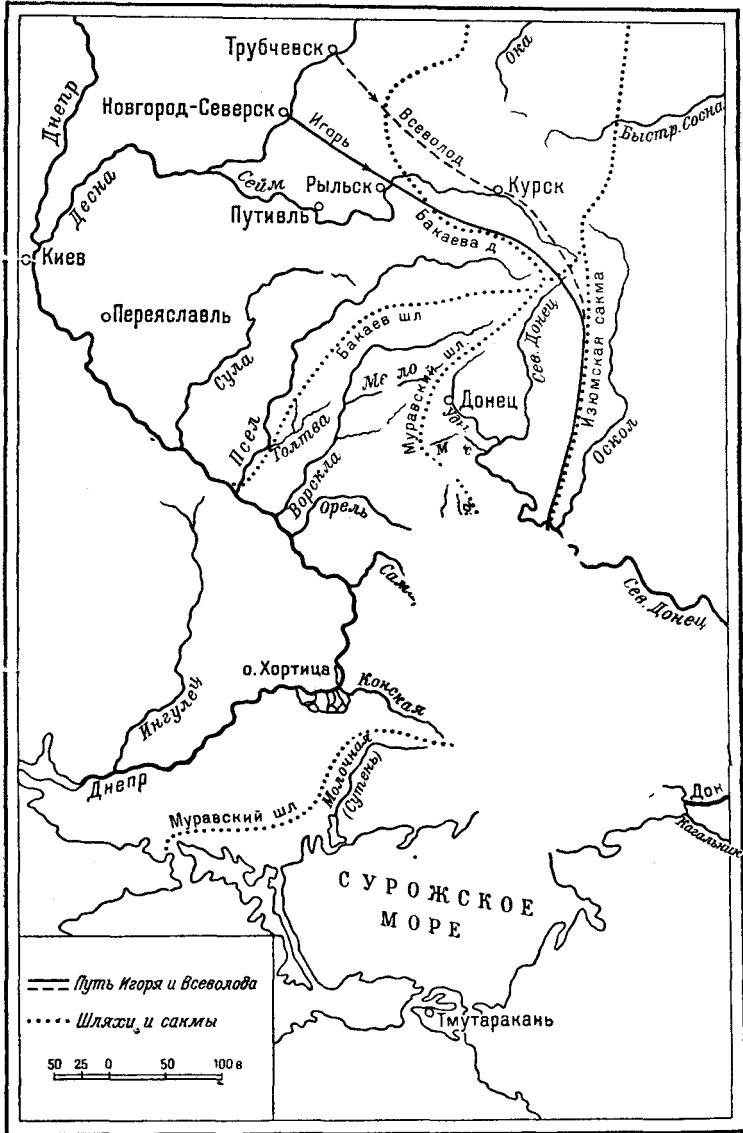
Маршрут похода Игоря 1185 г. (Вариант К. В. Кудряшова).

ловецким вежам, вдали от Орели. Несравненно проще и скорее можно было дойти до Орели Муравским шляхом, тем самым путем, которым Игорь ходил неоднократно: и в 1174 г. «в поле за Ворскло», и в 1184 г.,