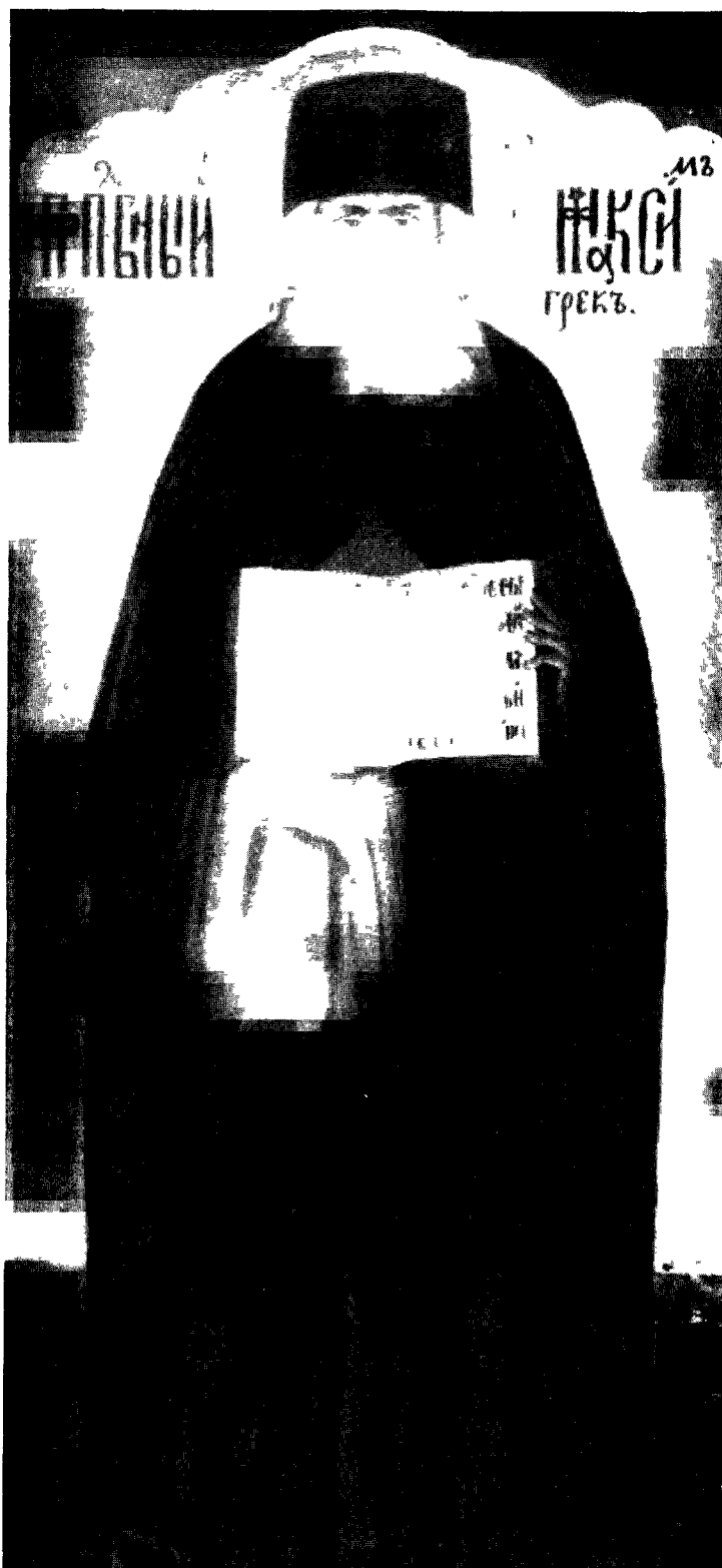
Рис. 2. Максим Грек Фреска Успенского собора Троице-Сергиева монастыря. 1684 г Северо-западный столб. (Фот Г. Б. Лебедева, 1957 г )