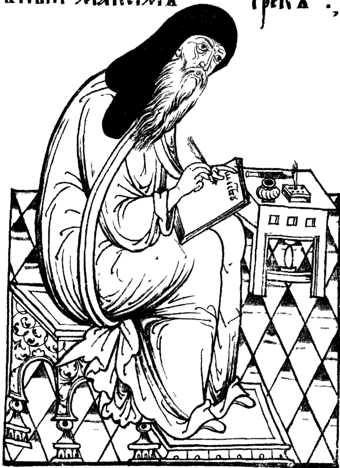
Рис. 1. Максим Грек. (Сборник БАН, Архангельское собр., № 1044, М. Б. № 15, XVII в., 4°, л. 10 об.).