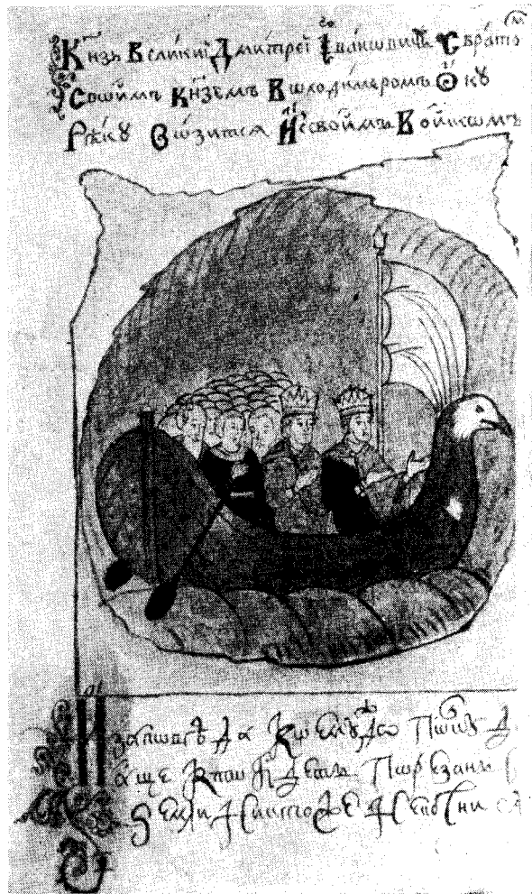
Рис. 2. «Князь великий Дмитрей Иванович с братом своим, князем Володимером, Оку реку возитася и с своим войском». (ГБЛ, собр. Музейное, 3155, начало XVIII в., л. 169 об.).

В Б — «Стражие великаго князя приведоша языка от сановитых царева двора». Композиционно миниатюра близка к Р 2 . Отличие: свиты за князьями нет, Дмитрий в правой руке держит жезл. В группе из трех человек справа трудно определить, кто татарин. По-видимому, это 2-й человек (он изображен старше, чем два других — с лысиной, усами и бородой), первый держит его левой рукой за правую, а свою