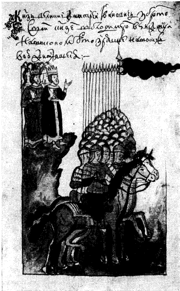
Рис. 3. «Князь великий Дмитрий Ивановичъ з братом своим, князем Володимиром, въздоша на высоко место, зряще на войску съвою, дивляшеся». (ГБЛ, собр. Музейное, 3155, начало XVIII в., л. 180 об.).

В Б (здесь это 21-я миниатюра) такая подпись: «Князь же великий паде на зеленой траве, прямо черному знамени, молится Спасову образу».