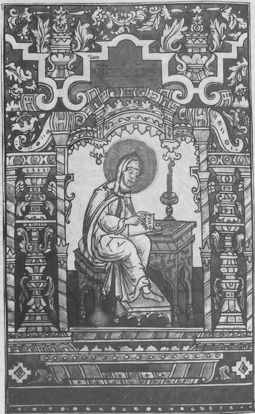
Рис. 3. Ефрем Сирин. Миниатюра в рукописном сборнике XVIII в. ИРЛИ, Древлехранилище, оп. 18 (собр. Плотникова), № 38.