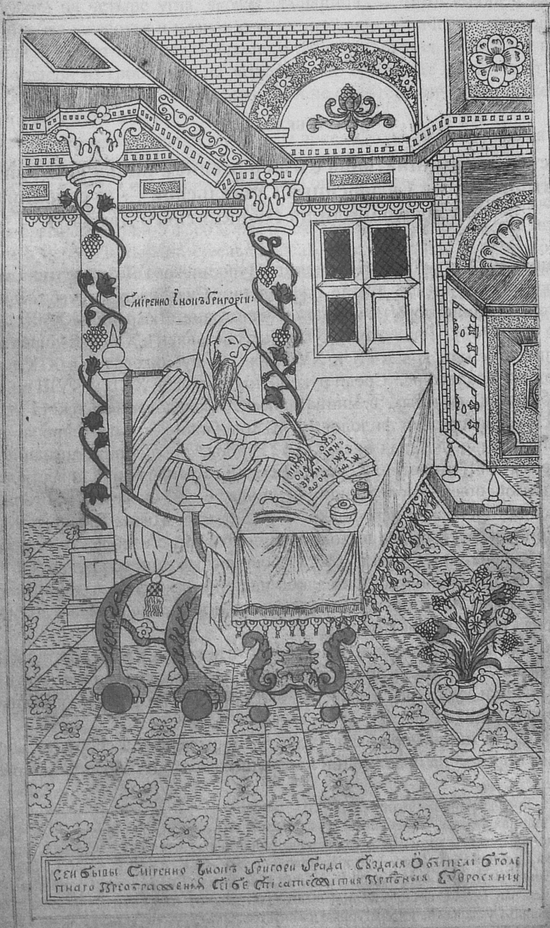
Рис. 1. Смирноинок Григорий — «списатель жития преподобныя Евфросинии». Миниатюра XVIII в. ИРЛИ, Древлехранилище, оп. 23, № 205, л. 8 об.