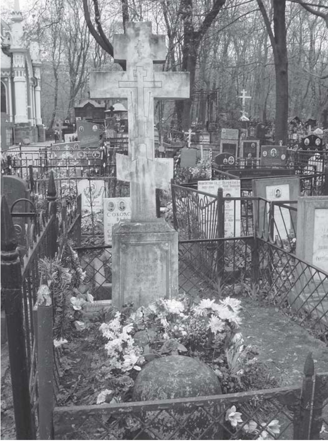
Рис. 2. Могила блаженного Иоанна Козмича на Преображенском кладбище (2007 г.)

сведениями, мы можем утверждать, что именно к этому подвижнику относятся отрывочные сведения, которые обнаруживаются в других письменных памятниках московских старообрядцев-беспоповцев.