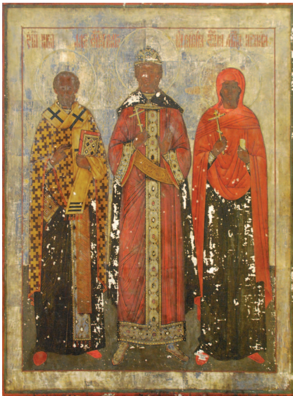
Икона «Свт. Николай, вмц. Варвара и Параскева Пятница», конец XVIII в. Северное Поонежье. Государственное музейное объединение «художественная культура Русского Севера» (Архангельск). Инв. 1581-држ АОМНИ. Публикуется впервые.