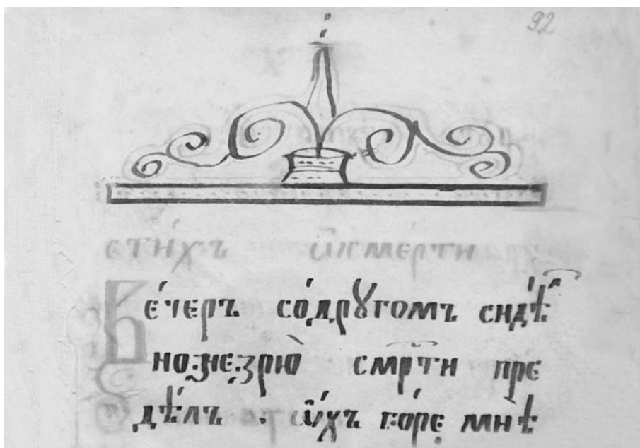
Сборник духовных стихов. Вятск. 41, л. 92. Писец — М. А. Чупраков.