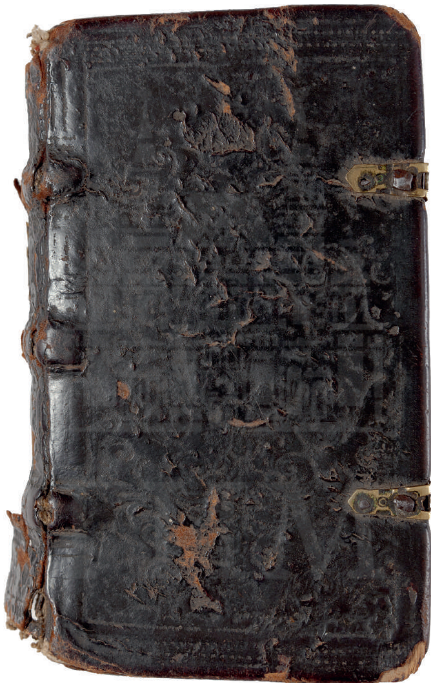
Ил. 1. Переплет «Цветника» Прохора Коломнятина. ГИМ. Музейск. 2803