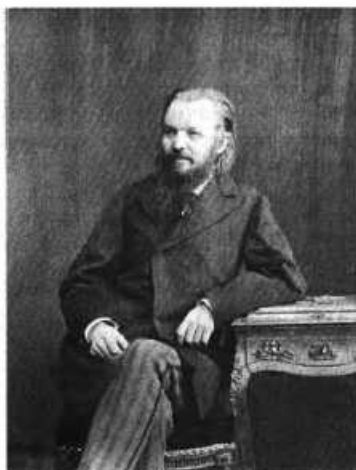
А. С. Суворин

Параллельное сотрудничество, помимо журнала Е. Тур, в таких изданиях, как «Современное слово», «Отечественные записки», «Современник», «Время», составило Суворину некоторое имя в журнальном мире. После закрытия «Русской речи» какое-то время он жил случайными заработками, составляя популярные брошюры на исторические темы, пока в конце 1862 года не последовали сразу два предложения о сотрудничестве от А. А. Краевского и В. Ф. Корша. Суворин выбрал последнего. 6 В редакции «С.-Петербургских ведомостей» на протяжении двух лет Суворин лишь секретарствовал — держал корректуры, ездил в типо-