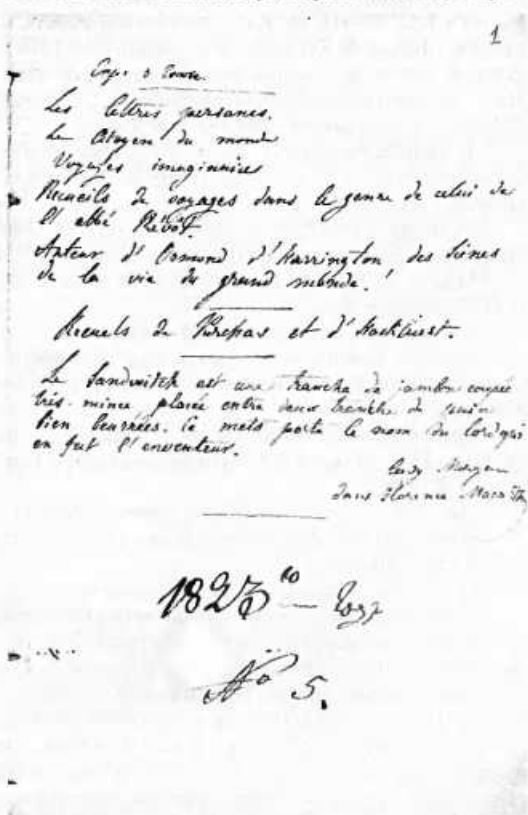
«Голубая тетрадь» Первая страница (ИРЛИ)

3 Как и многие женщины из дворянской среды, В. П. имела обыкновение делать выписки из понравившихся ей книг, которые называла «extraits» и заносила в специальные памятные книжки. В письмах к И. С. она нередко обращается к своим записям, цитируя Ж. Жанена, мадам де Жанлис и др. авторов. Подобных книжек, видимо, было несколько, однако до наших дней сохранились лишь две: московская — «Записи своих и чужих мыслей для сына Ивана» (1839–1843), хранящаяся в РГАЛИ, и так называемая «голубая тетрадь» (1823–1832), которая находится в ИРЛИ. Порядковый номер «5», выставленный на