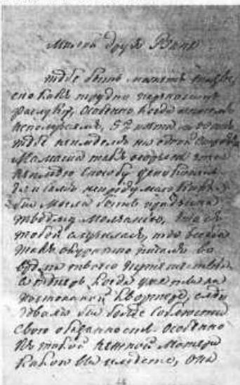
Письмо Н. Н. Тургенева к И. С. Тургеневу от 10 декабря 1838 г. Первая страница