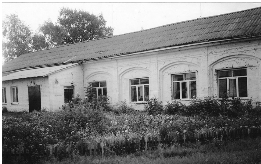
Здание каретного сарая в Брасове. Современная фотография

но отвергнуто), а затем собранию была предложена полная гласность. Заметим, что идея гласности была одной из главных в обращении Тургенева к Александру II, к сожалению, не дошедшем до адресата. 34 Уже на втором публичном заседании Комитета прекращение личной крепостной зависимости без вознаграждения прошло большинством голосов, а на четвертом было принято решение о том, «что крестьянские дома отдаются им даром». 35