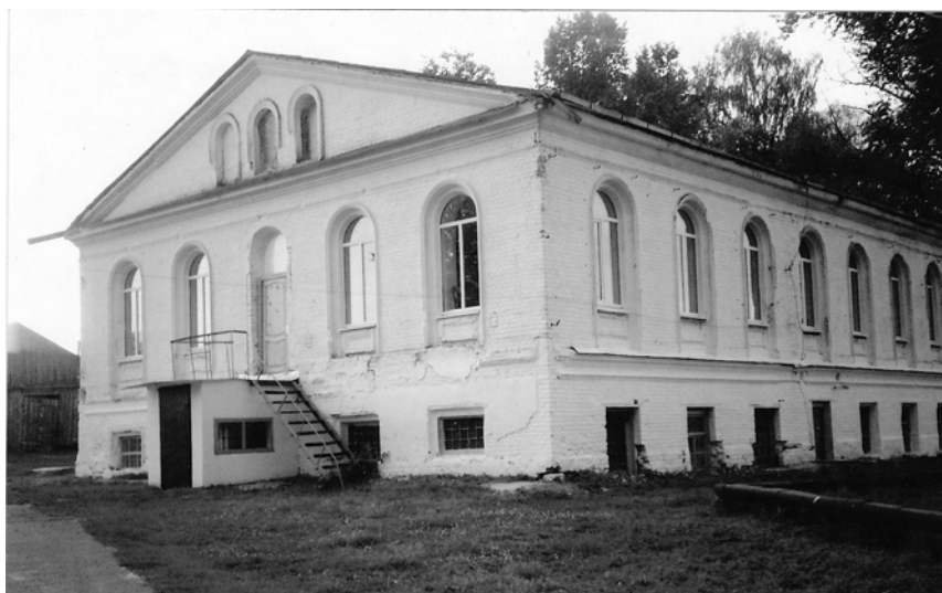
«Дом графа» в Брасове. Современная фотография

геновым и изложить ему свое мнение по поводу предстоящей работы Комитета и шире — на проблему освобождения крестьян.