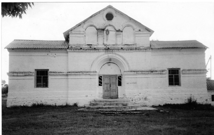
Здание конторы в Брасове. Современная фотография