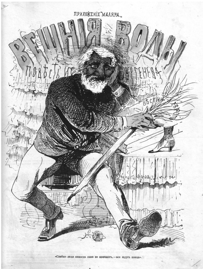
Карикатура на «Вешние воды» в приложении к журналу «Маляр» (1872). Первая страница