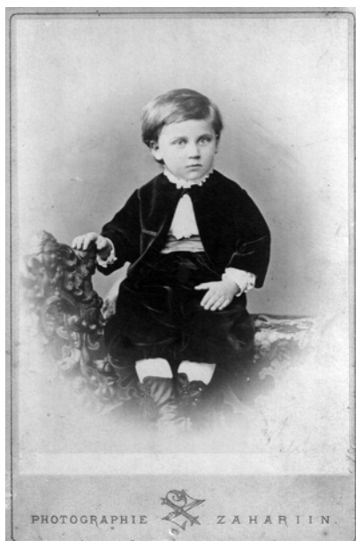
А. Я. Полонский в возрасте 3 лет и 9 месяцев. Фотография Захарьина. Петербург, 1871 г. (ИРЛИ)

была более благожелательной. После выхода первой части он отметил, что ему многое в ней понравилось, что «от нее веет искренностью, а местами поэзией», но в целом оценил ее невысоко: «...но все же мне сдается, что ты в подобных больших произведениях словно не дома, не в своем тоне поешь. Ты по преимуществу лирик с неподдельной, более сказочной, чем фантастической жилкой; а тут дело в анализе, в характере, в их столкновении и развитии... Это под руку прозаику» (ПССуП(2). Письма . Т. 12. С. 234). Выход второй части не изменил общего впечатления, произведенного на Тургенева первой, о чем он сообщил Полонскому 28 ноября (10 декабря) (см.: Там же. С. 248).