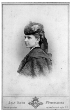
Ж. А. Полонская. Фотография И. А. Гоха. Петербург, Нач. 1870-х гг. (ИРЛИ)

«Да и все они очень красивы, — писал он Полонскому, — хотя „красавицами в полном смысле слова“ я бы их не назвал — и все очень тебя любят и сохраняют очень теплую память о тебе» (ПССуП(2). Письма. Т. 11. С. 207–208).