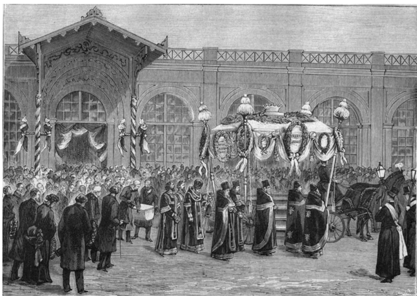
Похороны Тургенева. Постановка гроба на траурную колесницу у станции Варшавской железной дороги. Гравюра по рисунку К. Брожа. 1883 г.

ских социалистов и революционеров, известного Петра Лаврова. <...> Умер Тургенев и Лавров счел своим долгом почтить его память изъявлением благодарности за поддержку, которую тот оказывал Лаврову при издании социалистского и революционного органа „Вперед!“ . И вот теперь только и речи, что об этом якобы гнусном поступке Петра Лаврова; он-де оклеветал знаменитого писателя, он лжец, злоумышленник, негодяй. <...> Мы оказались чуть не соумышленниками Лаврова, чуть не продиктовали ему это заявление». При этом редактор «Московских ведомостей» дал неожиданное «объяснение» поступку писателя: «Пятьюстами франков, которые Тургенев ежегодно посылал в редакцию революционного журнала „Вперед“, и другими подобными щедротами он откупался от травли, которая не давала ему покоя в шестидесятых годах и которая сразу прекратилась в семидесятых, когда Тургенев решил платить дань печенегам и половцам». Версия Каткова, разумеется, не выдерживает критики, но по сути дела он был недалек от истины. Факт поддержки Тургеневым революционного органа отрицать нельзя, как нельзя не признать доли справедливости в следующем его утверждении: «Тургенев был художник по преимуществу. <...> Политические интересы мало занимали его, и он не имел твердого гражданского