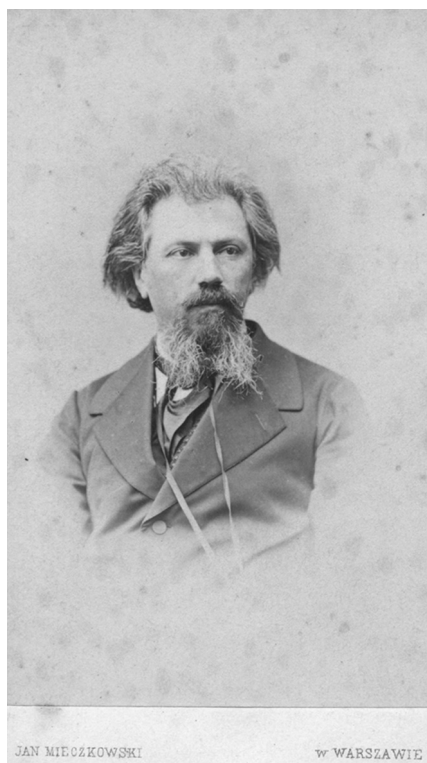
А. М. Жемчужников. Варшава, 1865 г. (?)

Ссылались на эти неизданные письма и исследователи творчества Жемчужникова. 2 Однако полностью письма Алексея Жемчужникова к Тургеневу не публиковались, и его «партия» в четырехлетнем эпистолярном диалоге 3 двух