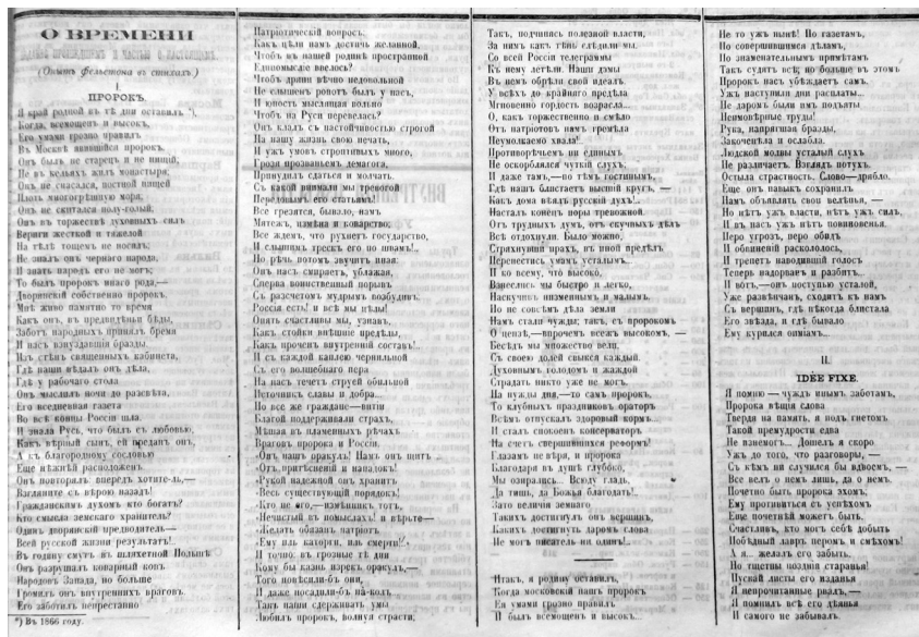
Поэма А. М. Жемчужникова «Пророк и я». Первопечатная редакция. (Санкт-Петербургские ведомости. 1870. 30 января. № 30)

редко читавший, по собственному признанию, «Московские ведомости» «во дни их славы», считал, что Жемчужников без достаточных оснований «дарит противника идей своих такой завидной ненавистью». 26 И в целом Жемчужников как поэт, в представлении Полонского, «до того субъективнее, что видеть предметы с разных сторон и относиться к ним объективнее или спокойнее он не может». По его же свидетельству, в середине 1860-х годов «упования Жемчужникова на людей, которым он верил, сменились досадой, а может быть, и тайным отчаянием». 27 Отъезд его из России был предопределен.